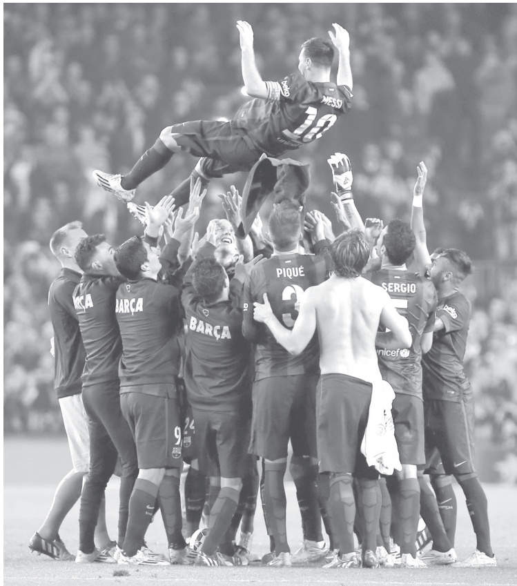
El jugador Lionel Messi (arriba) de Barcelona, festeja con sus compañeros de equipo.

en todo el ámbito azulgrana y generaron preocupación. Sin embargo, hoy el Camp Nou recuperó al mejor Messi, aquel que hizo delirar durante casi diez años a los hinchas del