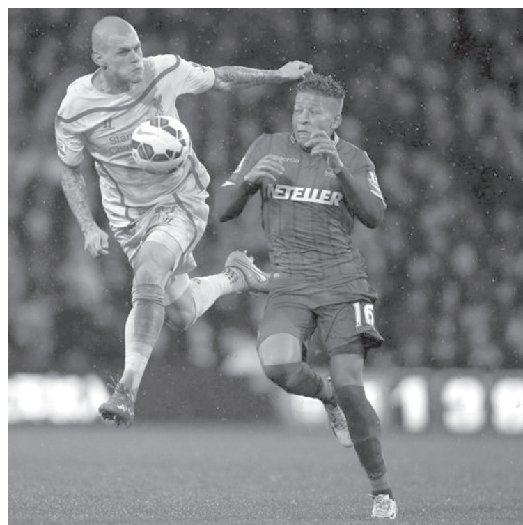
El Liverpool sigue sin rumbo en la Premier.

La Premier League tiene como líder indiscutido al Chelsea, que el sábado venció 2-0 al West Bromwich Albion. Mañana, el Southampton, único escolta, intentará acortar distancias cuando visite al Aston Villa.