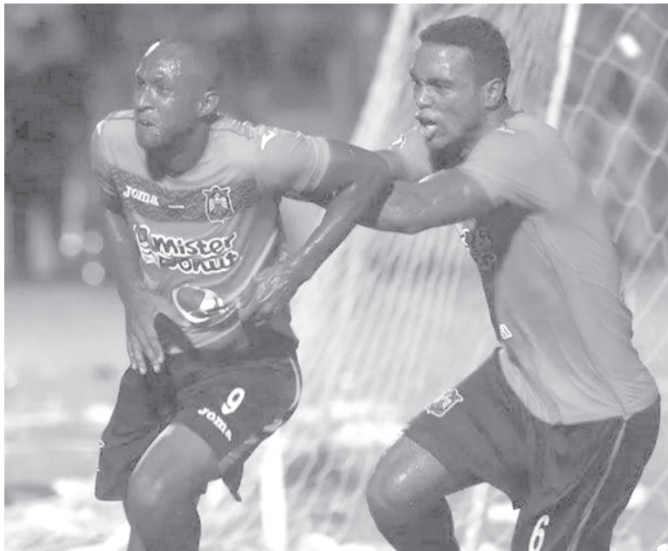
El conjunto emplumado se quedó con el derbi oriental al derrotar 2-1 a Dragón.

La diana permitió a los anaranjados irse al descanso en ventaja y apostar por una estrategia más conservadora en el complemento. Así, mientras los mitológicos buscaron hacer daño y conseguir la paridad teniendo el balón en su poder, Águila se dedicó