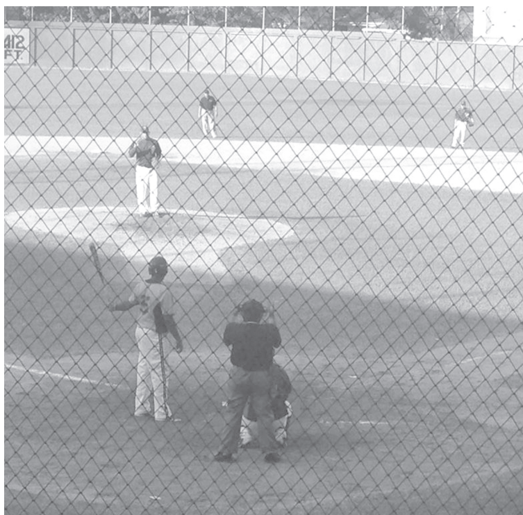
Titanes derrotó 7-1 a Águila.

Titanes continua como el gran ganador dentro de la Liga Nacional de Béisbol, esto luego de vencer el fin de semana al conjunto de San Miguel, Águila, quien sumó su cuarta derrota. El partido, disputado en el Parque de Pelotas Saturnino Bengoa, tuvo muchos aciertos y desaciertos para ambas escuadras. Aunque Titanes fue superior, fue hasta el tercer inning que abrió el marcador. Sumando, además, en este inning dos carreras más y poniendo un marcador de 3-0