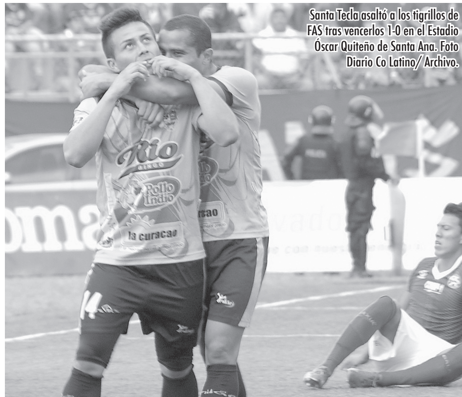
Santa Tecla asaltó a los tigrillos de FAS tras vencerlos 1-0 en el Estadio Óscar Quiteño de Santa Ana.

La derrota deja tocado a los santanecos que tendrán que jugar a muerte ante Isidro Metapán en la próxima fecha. Santa Tecla, en cambio, tiene un partido más accesible, jugará en casa ante Atlético Marte.