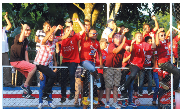
Los aficionados de Juventud Independiente festejaron eufóricos al finalizar el partido en el que derrotaron a Isidro Metapán.