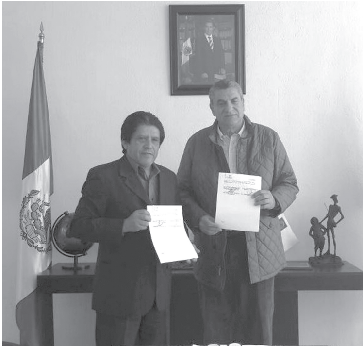
INDES firmó convenio de cooperación con el Gobierno de Puebla, México.

Redacción Diario Co Latino @Diario Co Latino