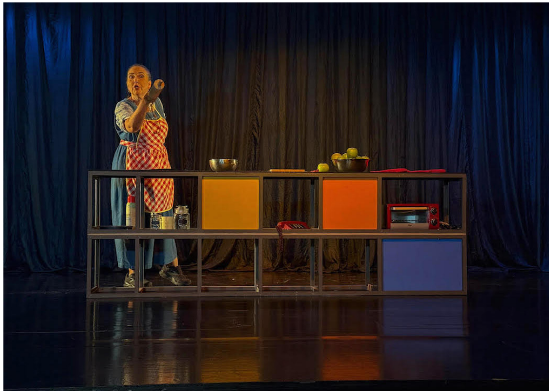
El Teatro Luis Poma y parte del elenco de los montajes presentan el Acto 3 de la Temporada 2026; serán seis montajes cargados de emociones. Los boletos para las funciones ya pueden adquirirse en su sitio web.

“El Acto 3 reúne dos obras latinoamericanas contemporáneas, un espectáculo internacional, una mirada original