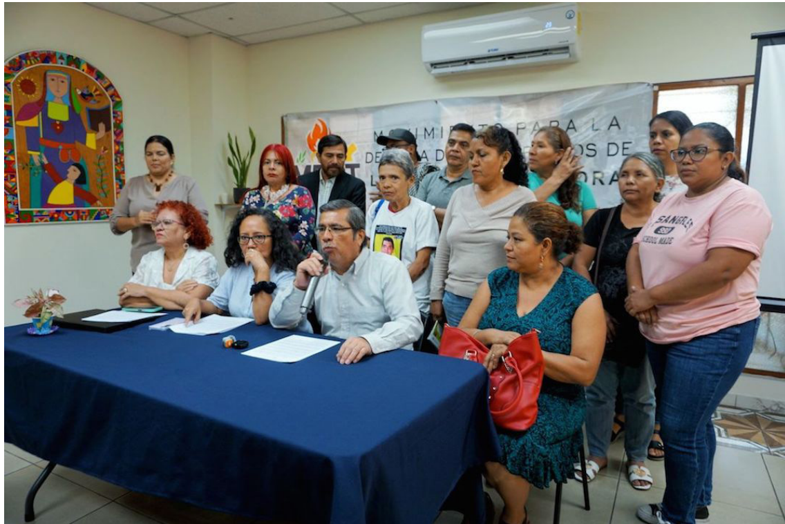
El movimiento también solicitó retirar el anteproyecto de Ley de Desarrollo Social al considerar que debilita la institucionalidad de protección social vigente desde 2014.

El MDCT también hizo un llamado a ratificar el Convenio 189 de la OIT para proteger a las más de 140 mil trabajadoras remuneradas del hogar. Además, solicitó eliminar el régimen especial que considera discriminato-