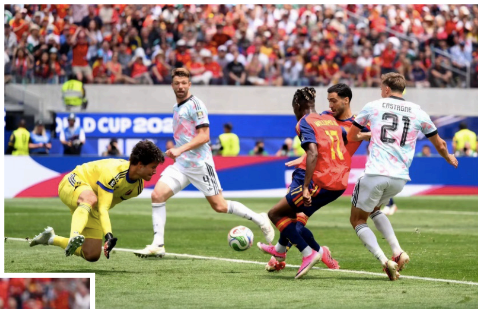
España alcanza las semifinales de la Copa del Mundo 2026 luego de eliminar a Bélgica por 2-1 y se enfrentará a Francia en la siguiente ronda.