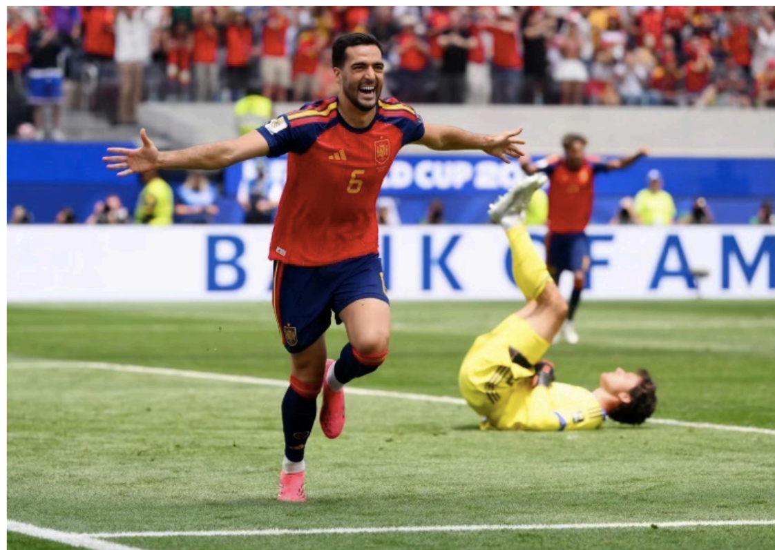
Mikel Merino marca el 2-1 de la clasificación de España ante Bélgica en la Copa del Mundo 2026.