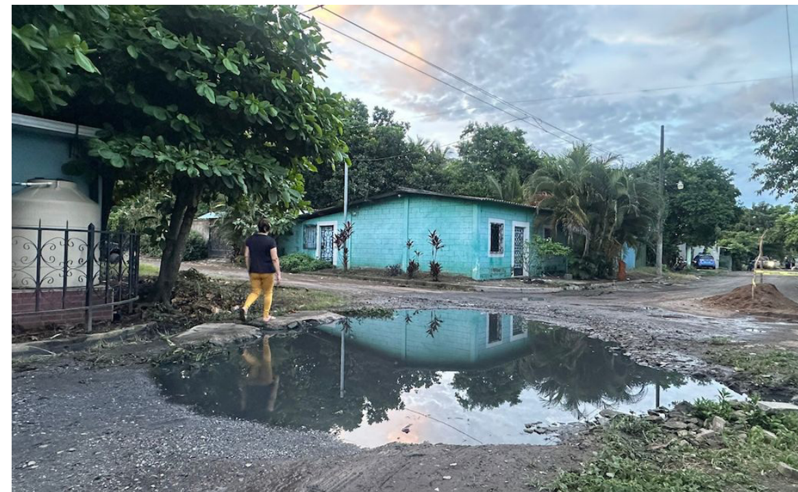
Los residentes afirmaron que varias administraciones municipales han prometido pavimentar la calle principal, pero el proyecto continúa sin ejecutarse.

Saúl Méndez @DiarioCoLatino / Colaborador