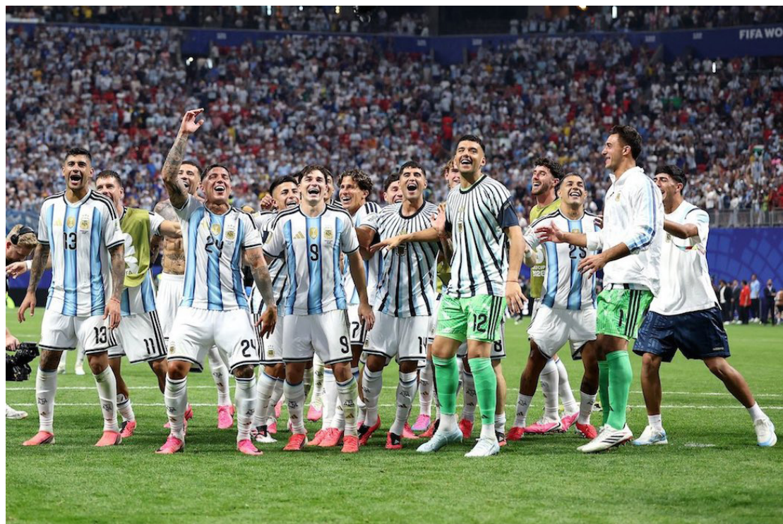
Argentina celebra la clasificación a cuartos de final de la Copa del Mundo 2026 tras remontar a Egipto.