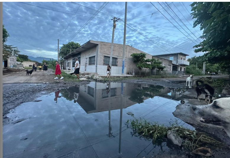
Vecinos aseguran que el deterioro de la vía dificulta el ingreso de vehículos, afecta a los comercios y favorece la formación de criaderos de zancudos.