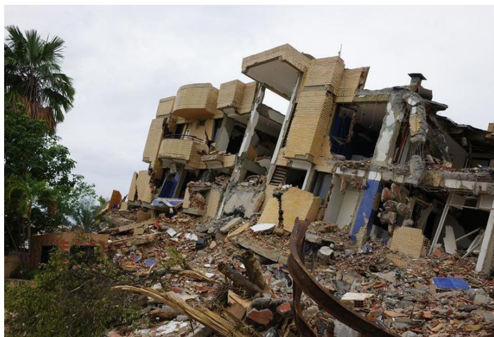
Imagen del 3 de julio de 2026 de los escombros de un edificio colapsado destruido por los terremotos, en Caraballeda, estado La Guaira, Venezuela.

Durante un acto en la avenida Bolívar de Caracas, donde dio inicio al despliegue de la Gran Misión Venezuela Renace para la construcción y reparación de viviendas, Rodríguez explicó que la petición busca incorporar la experiencia de países con alta activi-