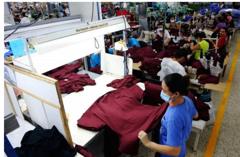
Mujeres Transformando recordó que el Día Nacional de la Persona Trabajadora de la Maquila surgió tras la intoxicación química sufrida por obreras del sector en 2002.

Además, el colectivo reiteró su compromiso de fortalecer alianzas entre mujeres y promover redes de apoyo para la defensa de los derechos laborales y la organización colectiva.