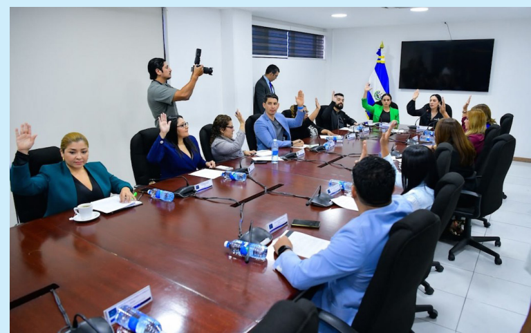
El dictamen pasará al pleno legislativo este miércoles en la sesión plenaria.

des, sosteniéndonos y abrazándonos entre nosotras”, concluyó Mujeres Transformando.