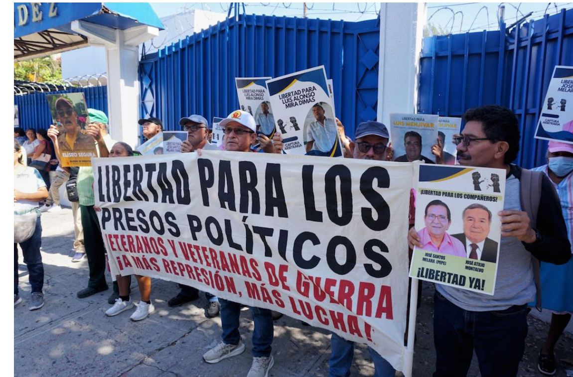
Los manifestantes calificaron como arbitrario el proceso judicial contra los líderes de la Alianza Nacional El Salvador en Paz y denunciaron la falta de pruebas en el caso.

“Sin embargo, desde 2019, todo lo que se había conquistado en materia de democracia y respeto a los derechos humanos se ha venido abajo debido a una serie de acciones orientadas a consolidar una dictadura que prioriza la acumulación de riqueza del clan familiar que controla las instituciones del Estado, en detrimento