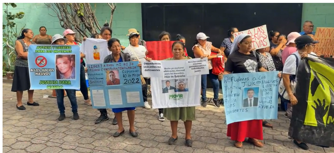
Las madres piden que a sus hijos detenidos injustamente se les desarrolle un juicio justo y no colectivo, ya que esta última acción provoca que los inocentes sean condenados junto con los verdaderos pandilleros.

El régimen de excepción se implementó desde el 27 de marzo de 2022; luego de un repunte en los homicidios que según investigaciones periodísticas se dieron luego de la finalización de la tregua entre el Gobierno de Bukele y las pandillas. Desde entonces se han detenido a más de 92 mil personas; entre ellos, personas que nada tienen que ver con pandillas; inclusive el mismo Gobierno ha reconocido que ha detenido a personas sin vinculaciones con pandillas que ha liberado luego de indagar su perfil.