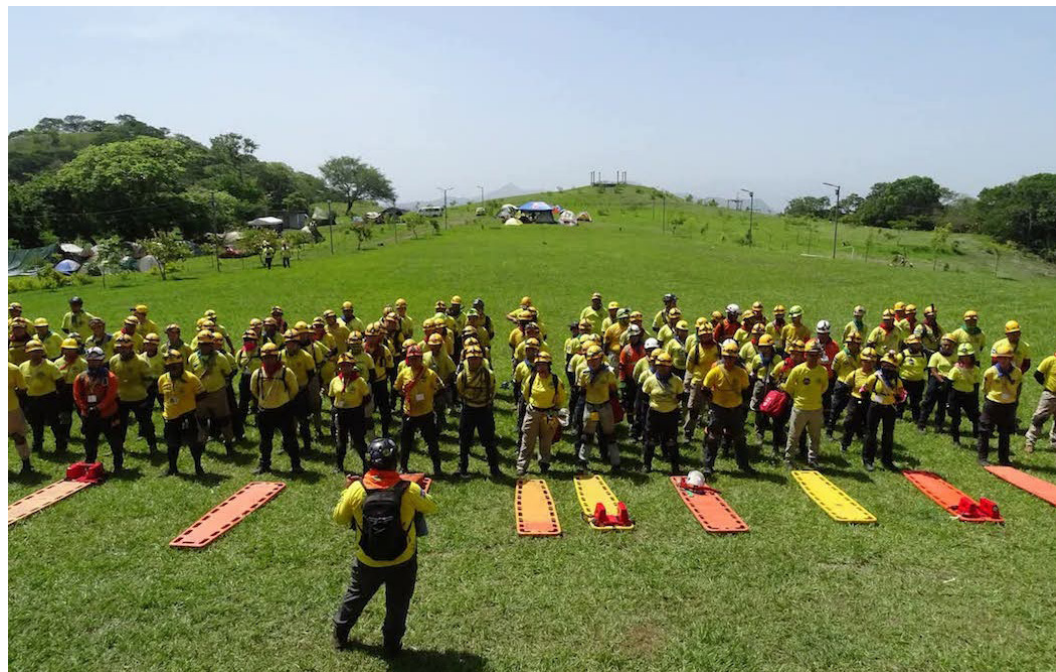
Durante tres días, socorristas de distintas seccionales fortalecieron sus conocimientos en rescate vertical, rescate vehicular, atención prehospitalaria y Sistema de Comando de Incidentes.

El teniente general Juan Gutiérrez, quien lideró el grupo de instructores, agradeció a los so-