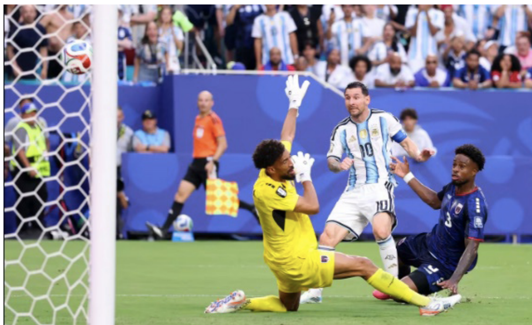
Messi marca el 1-0 de Argentina ante Cabo Verde en los 16avos de final de la Copa del Mundo 2026.

A los 92', un grito de gol más resonó en Miami, esta vez a nombre de Lisandro Martínez, que apareció de