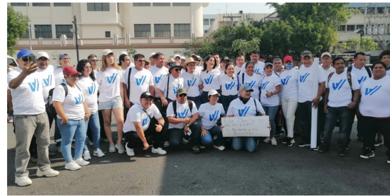
Partido VAMOS participa en diferentes expresiones públicas que realiza la ciudadanía referente a la exigencia del respeto a los derechos humanos, laborales, y democracia.

“A quienes han creído en esta causa, a quienes se sumaron hace años y a quienes re-