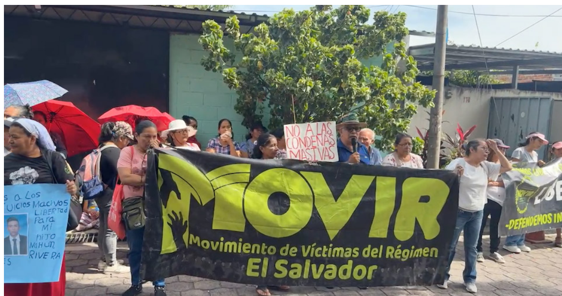
El MOVIR se concentra en las afueras del Centro Judicial de Soyapango para protestar contra las audiencias masivas.