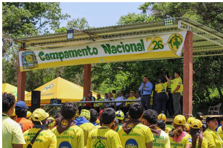
El campamento contó con el apoyo de instructores internacionales de la Academia Mundial de Bomberos Inc. y Ayuda Popular Noruega.