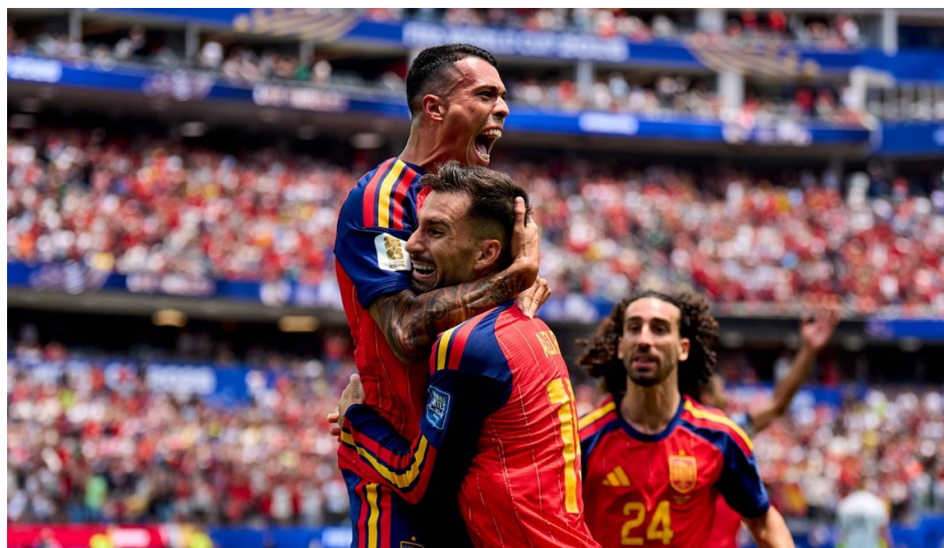
Pedro Porro marca el 2-0 de España ante Austria en los 16avos de final de la Copa del Mundo.

La Roja cerró la fase de grupos con paso firme, al sumar dos victorias y un empate. Con el triunfo sobre Austria aseguró su clasificación a los octavos de final, donde enfrentará al ganador del duelo entre Portugal y Croacia, un cruce que promete grandes emociones.