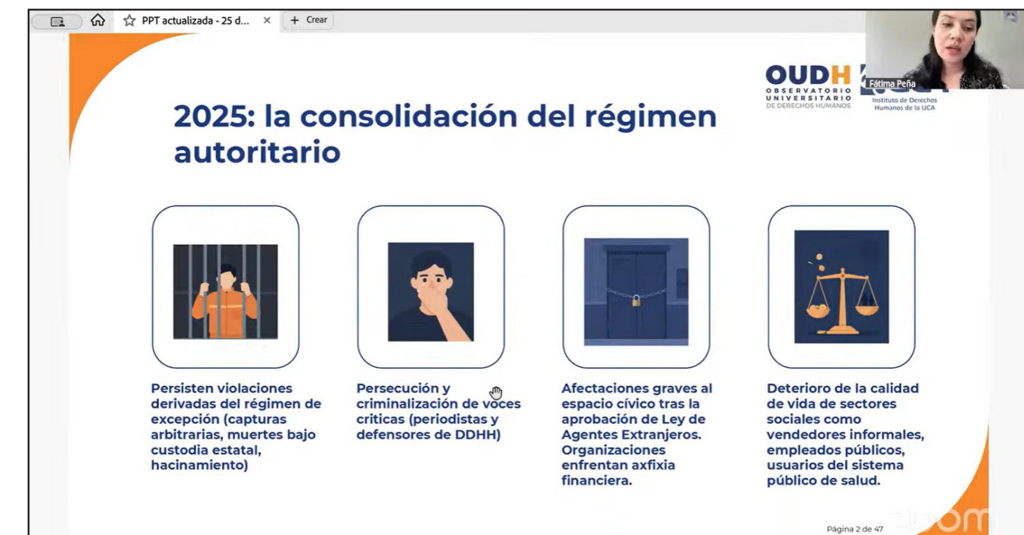
Estas son las principales características que ha tenido el año 2025 en El Salvador, en materia de derechos humanos.

frentan asfixia financiera ya que se les quita el 30 % de las donaciones que reciben de agentes internacionales para temas de derechos humanos, de medioambiente, de género y mujeres y otros.