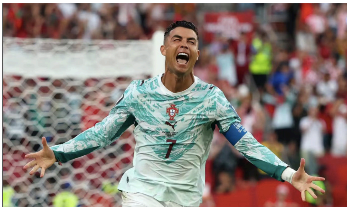
Cristiano Ronaldo marca el 1-1 ante Croacia en los 16avos de final de la Copa del Mundo rumbo a los octavos.