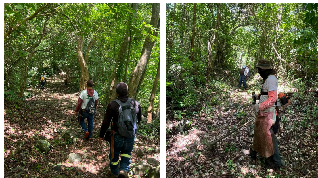
La organización impulsa programas de reforestación, educación ambiental y saneamiento para contribuir a la conservación del lago de Coatepeque.

Saúl Méndez @DiarioCoLatino / Colaborador