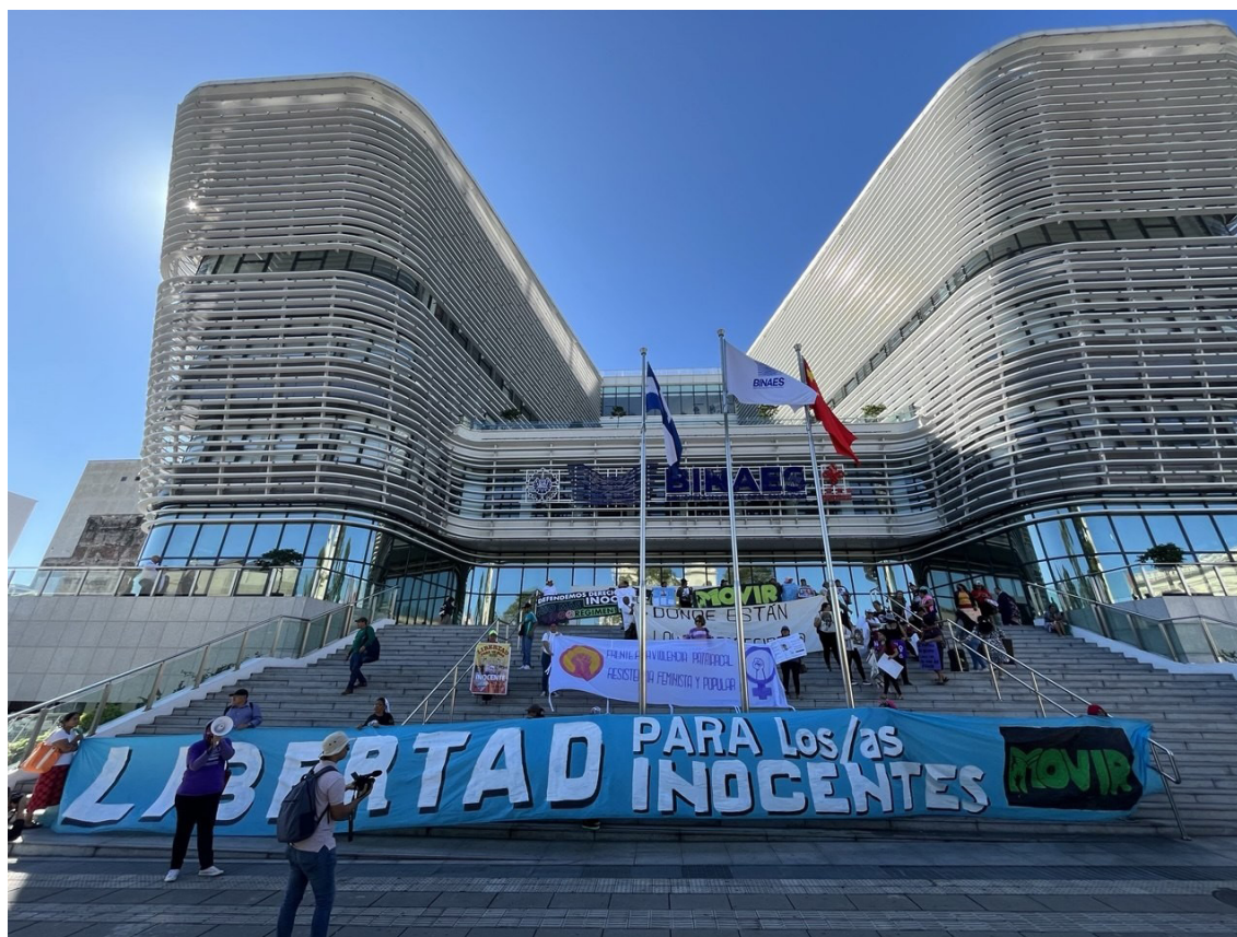
Centenares de personas que tienen a sus familiares detenidos bajo el régimen de excepción salen a las calles para pedir su liberación, ya que consideran que no tienen vínculos con pandillas.

Según las denuncias, el derecho a la libertad personal, el derecho a la seguridad personal y el derecho a la integridad personal son los más afectados con 137, 76 y 31 denuncias, respectivamente. Mientras que los hechos violatorios son las detenciones arbitrarias (136), las persecuciones o indagaciones ilegales (64), intimidación (31),