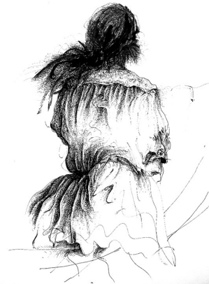
Dibujo: Augusto Crespin

En la panadería hay perros que no ladran. Esperan que alguien grite: el ultimo.