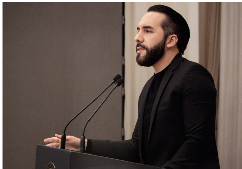
Nayib Bukele se postulará para ejercer la Presidencia por 6 años más, luego de las reformas constitucionales que realizó su partido.

En la imagen se observa el expediente con los formularios oficiales, firmados y sellados con el emblema del partido, donde se detallan los documentos requeridos y verificados para la inscripción de ambos aspirantes. Quien aspi-