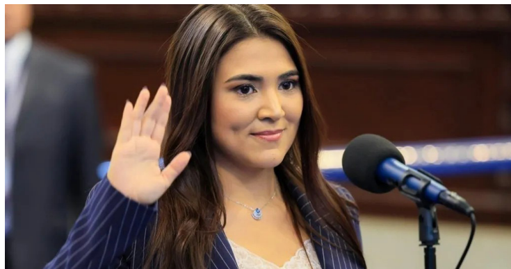
Alexia Rivas se inscribe como precandidata a diputada por la Diáspora, según lo informó este domingo.

La diputada de Nuevas Ideas, Alexia Rivas, informó que buscará una diputación en la circunscripción de los salvadoreños en el exterior; es decir, deja de competir en San Salvador para buscar representar a la diáspora.