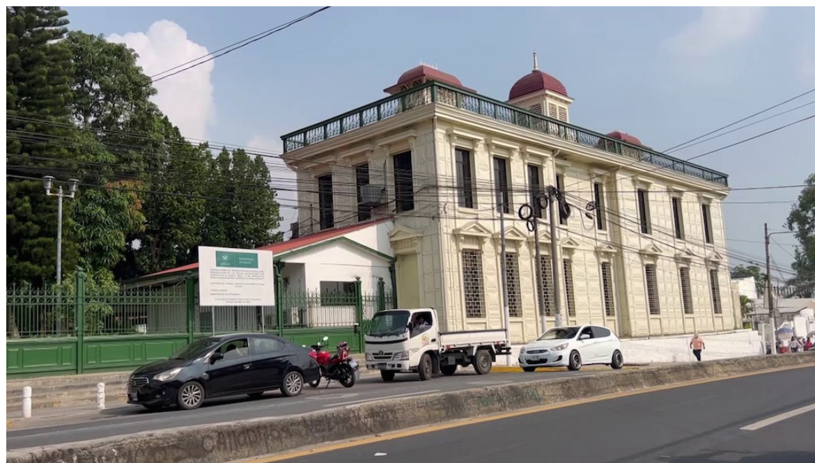
Los extrabajadores afirmaron que el Gobierno continúa contratando personal para cubrir las plazas que ellos ocupaban, mientras sigue pendiente el pago de sus indemnizaciones.

Los cientos de trabajadores despedidos del Hospital Nacional Rosales relataron que el anuncio fue realizado el 23 de diciembre de 2025, sin previo aviso y de forma verbal. La medida afectó a médicos, enfermeras, personal administrativo