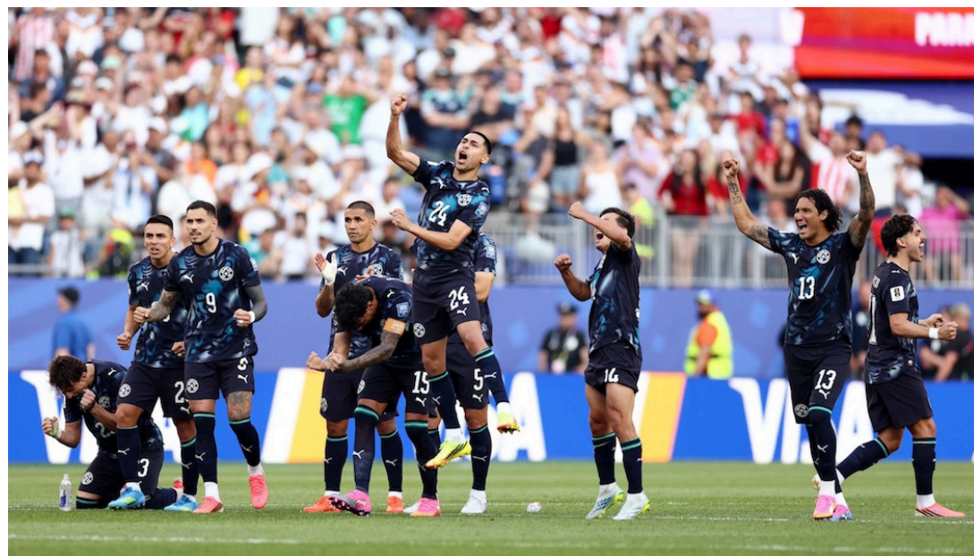
Paraguay elimina a Alemania de la Copa del Mundo en penales y alcanza la fase de 8vos de final.

Desde los once metros, Marruecos selló su clasificación a los octavos de final con la actuación estelar de Bono y se unió a Canadá, Brasil y Paraguay entre los equipos ya clasificados.