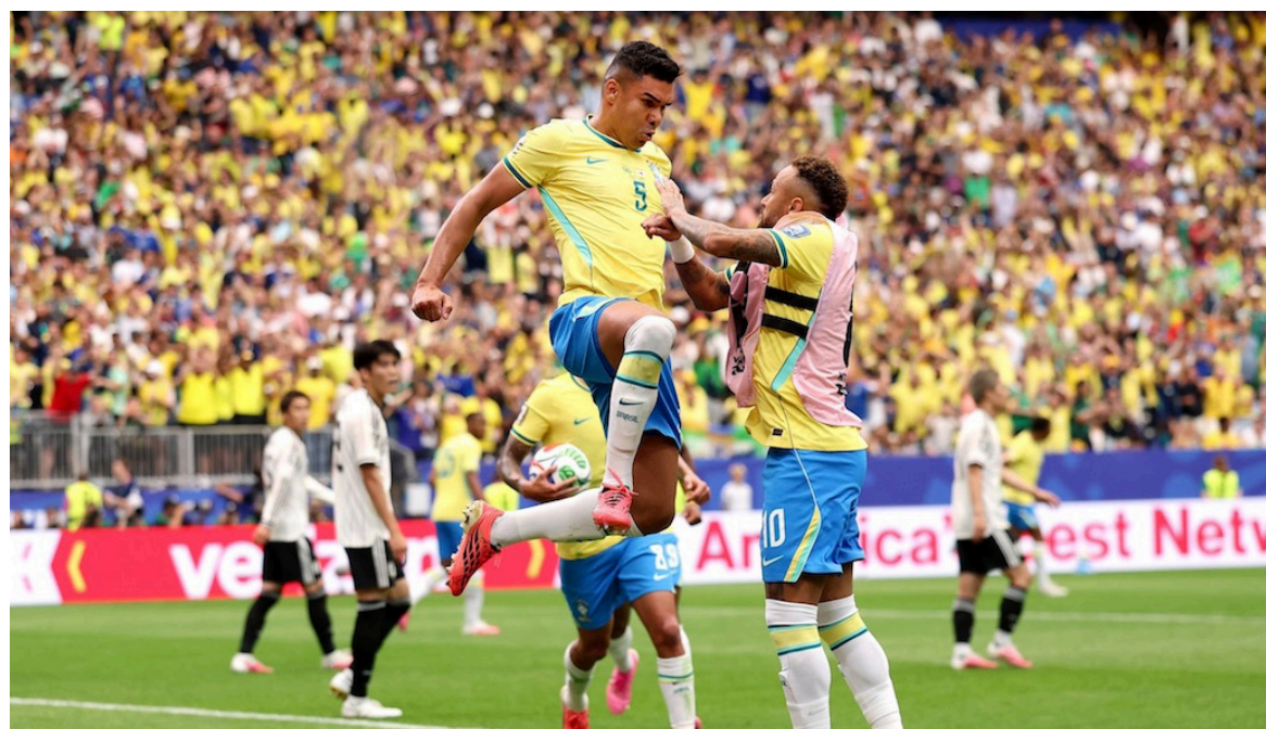
Casemiro lo empuja a un jugador japonés durante el partido.

Y cuando Brasil necesitó un héroe, apareció Gabriel Martinelli para darle un respiro al conjunto sudamericano al 90'+5'. El atacante del Arsenal