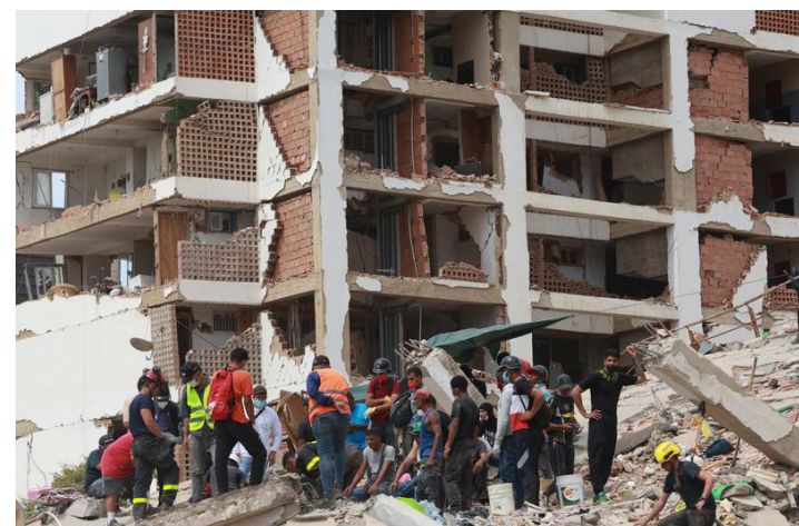
Personas afectadas son vista en un campo de béisbol tras la ocurrencia de dos terremotos, en Catia La Mar, estado de La Guaira, Venezuela, el 28 de junio de 2026.

Precisó que se ha establecido el mecanismo de reconocimiento por huella de todas las personas que ingresarán a los campamentos transitorios e indicó que trabajan en la logística de quienes se encuentran en espacios públicos, principalmente en parques, “para que tengan reposo, descanso, apoyo logístico y podamos nosotros en conjunto seguir resolviendo la si-