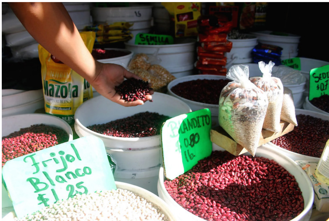
La economía sigue siendo el principal problema del país, según las encuestas de la UCA durante los últimos años.

Los principales logros del gobierno son la seguridad para un 47% de las personas y el combate a las pandillas para un 17.3%.