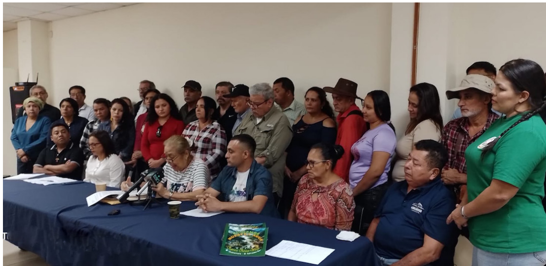
Habitantes de la Comunidad Santa Marta y San Isidro en Cabañas, con el respaldo de organizaciones sociales denuncian posibles desalojos para futuros proyectos mineros.

Dentro de los terrenos que la empresa en cuestión reclama existen agujeros de 500 metros de profundidad que ya fueron explorados en el pasado y ese, “es el interés específico que tiene la empresa de desalojar a las personas y poder ampliar los accesos, según el mismo personal de la alcaldía que ha estado