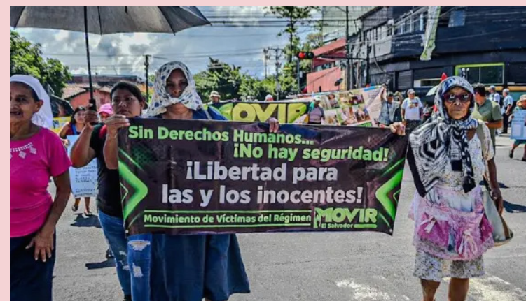
En las calles de San Salvador, cientos de familiares de detenidos piden la liberación de sus seres queridos. Muchas madres tienen incluso años sin saber del paradero.