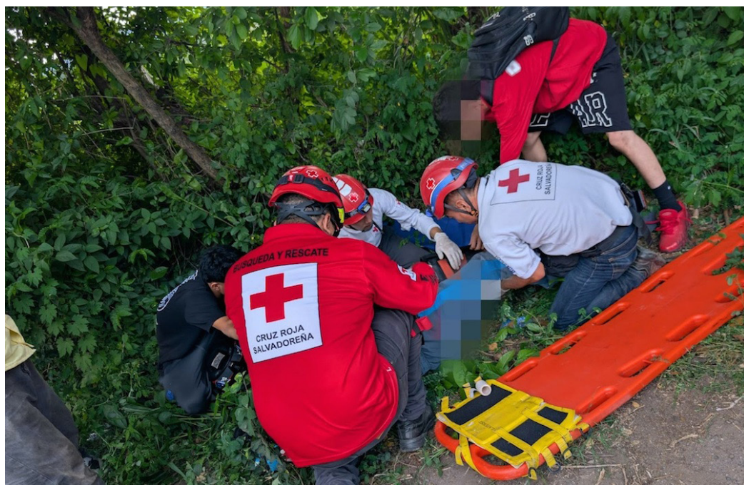
Cada 24 de junio se conmemora el Día Internacional del Socorrista, una fecha inspirada en el legado humanitario de Henry Dunant.

“Hoy reconocemos a quienes continúan ese legado, sirviendo con valentía, solidaridad y compromiso para aliviar el sufrimiento humano en todo el mundo”