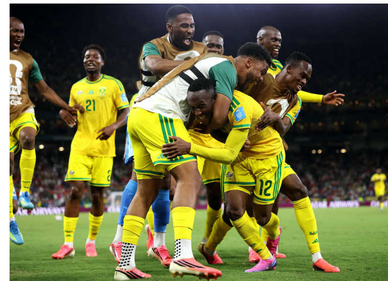
Sudáfrica celebra su clasificación a los 16vos de final de la Copa Mundial de la FIFA tras derrotar 1-0 a Corea del Sur.