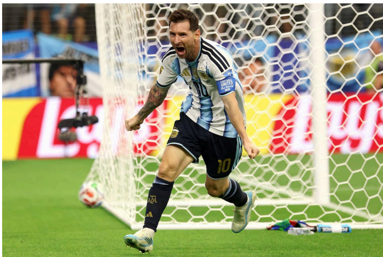
Lionel Messi celebra el 2-0 ante Austria que clasifica a Argentina a los 16vos de final de la Copa del Mundo y lo convierte en máximo goleador de mundiales.

El grupo J está liderado por la albiceleste con seis unidades, le sigue Austria por debajo con tres y Jordania y Argelia que hasta la fecha no han sumado puntos.