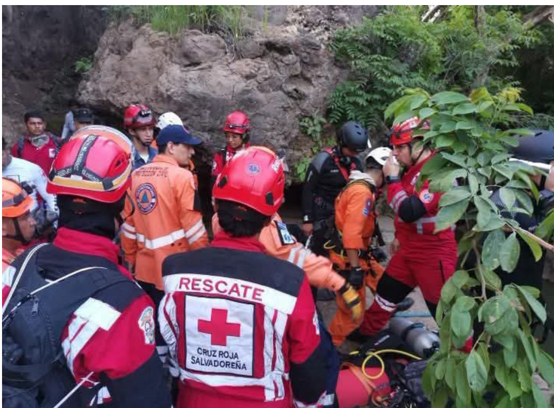
El cuerpo del ciudadano estadounidense fue localizado horas después de desaparecer en una de las pozas del Salto de Malacatiupán.