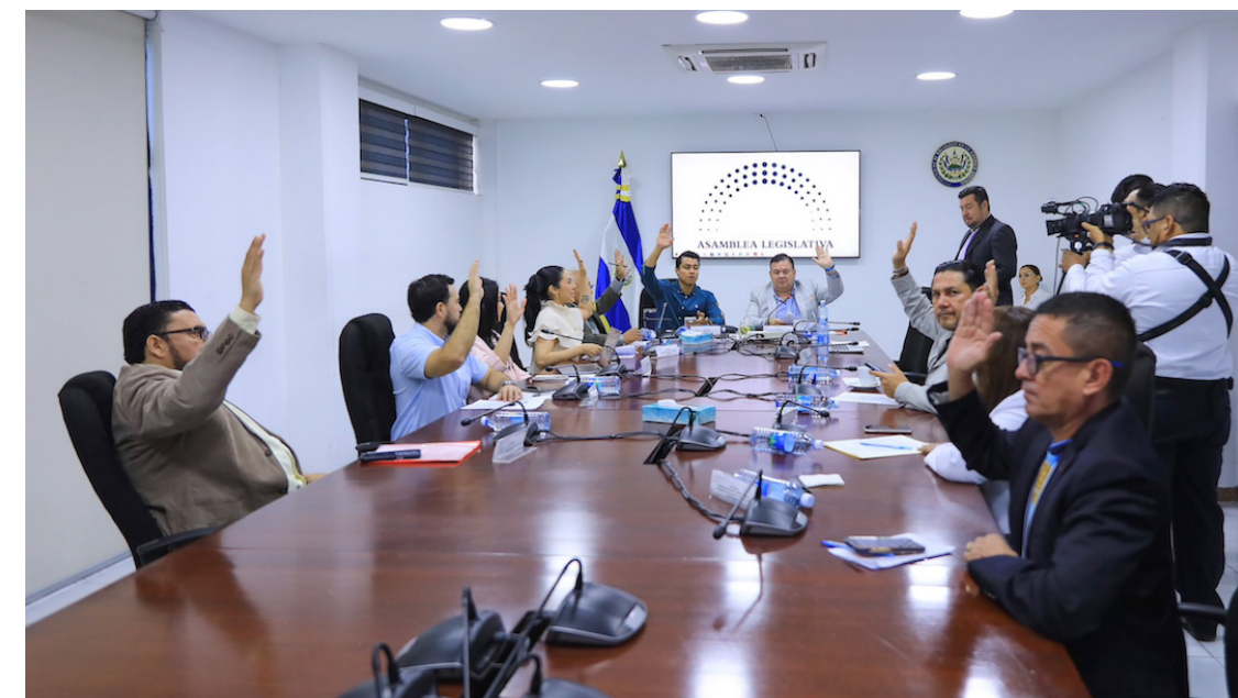
Diputados aprueban dos dictámenes para adquirir $340 millones provenientes de préstamos con el BCIE.