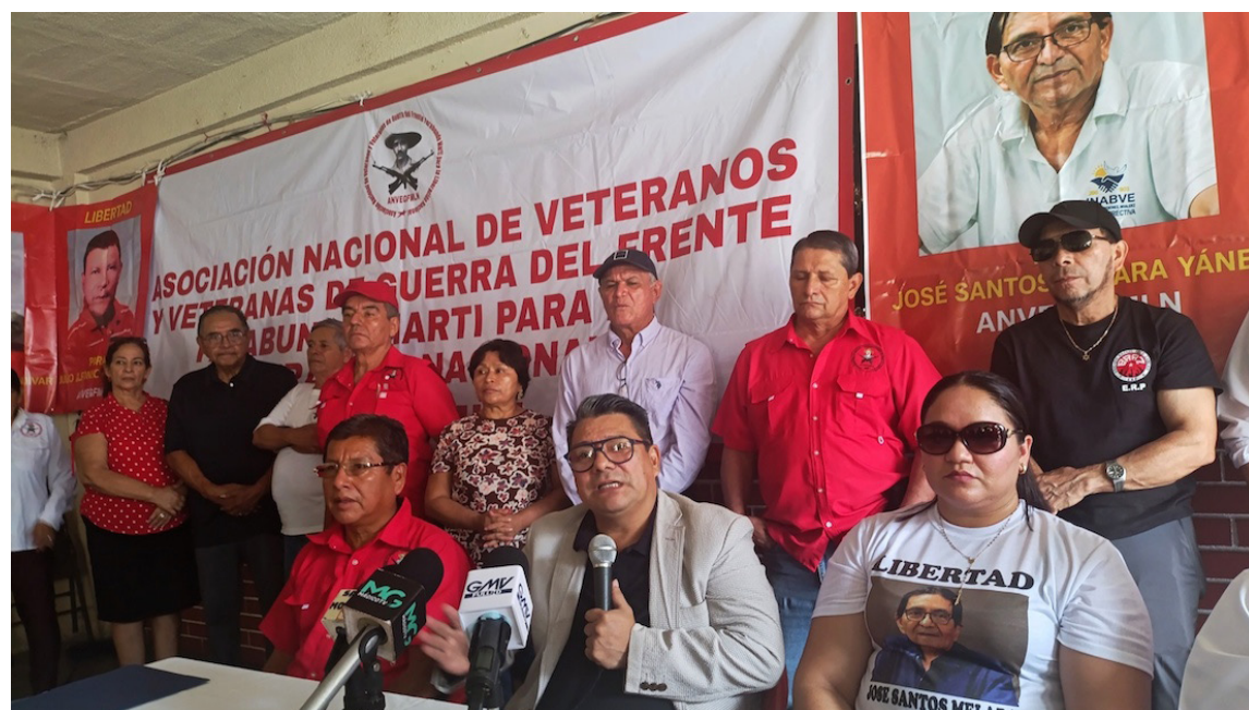
Familiares, abogados y organizaciones de veteranos sostienen que el caso contra los líderes de la Alianza Nacional El Salvador en Paz responde a una persecución política.

“Responsabilizamos al fiscal general de la República y al director general de Centros Penales por la comisión de crímenes de lesa humanidad, tal como regula el Estatuto de Roma en su artículo 7. Para los efectos del presente Estatuto, se entenderá por crimen de lesa humanidad cualquiera de los actos siguientes: encarcelación u otra privación grave de la libertad física en violación de normas fundamentales del derecho internacional; tortura, entendida como causar intencionalmente dolor o sufrimientos graves, ya sean físicos o mentales, a una persona que el acusado tenga bajo su custodia o control”, concluyeron.