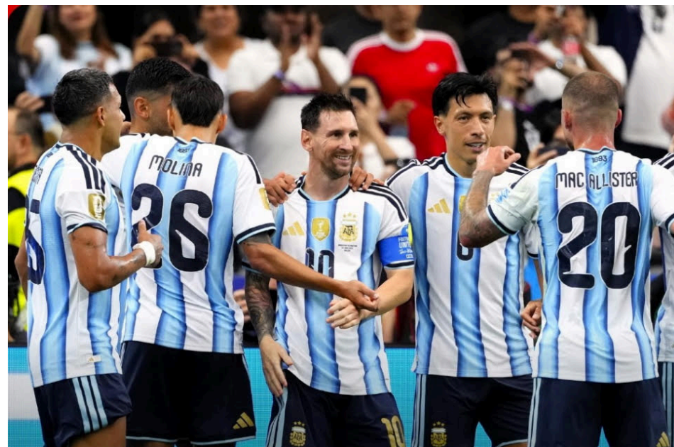
La selección de Argentina celebra la victoria de 2-0 ante Austria en la segunda fecha de fase de grupos de la Copa Mundial de la FIFA.