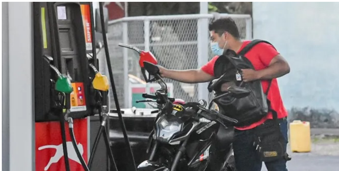
Será la tercera ocasión en que los precios de los combustibles se mantendrán igual respecto a su precio.

Otro factor son los ataques de Israel contra Hezbolá en el Líbano, violando el acuerdo provisional entre Estados Unidos e Irán, esto genera inestabilidad en los mercados internacionales de los hidrocarburos.