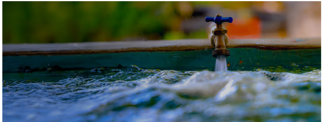
Los fondos servirán para mejorar el sistema de agua potable y para infraestructura vial y movilidad urbana, según lo menciona el decreto.

Sobre los intereses, se pagará una tasa establecida por el BCIE de acuerdo con su política de tasas de interés. La tasa de interés estará integrada por la Tasa de Referencia, revisable y ajustable semestralmente, más un margen establecido por el BCIE que inicialmente po-