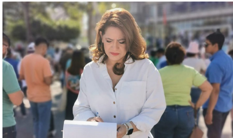
Karina Sosa, diputada del Parlamento Centroamericana por el FMLN y precandidata a diputada por la Asamblea Legislativa.

Según la parlamentaria centroamericana, la ciudadanía percibe que la actual Asamblea ha actuado de manera subordinada al Ejecutivo, sin ejercer suficientes funciones de control y debate. A su juicio, esto ha generado una imagen negativa entre sectores de la población, que consideran que los diputados oficialistas se limitan a respaldar las iniciativas del Gobierno sin mayor