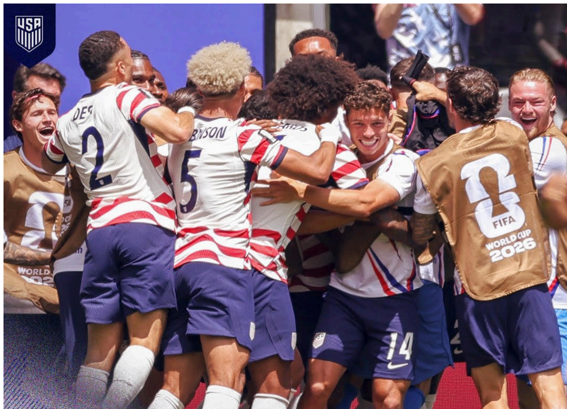
Estados Unidos celebra su victoria ante Australia y pase a los dieciseisavos de final de la Copa Mundial de la FIFA.

las 8:00 p.m. enfrentará a la selección de la media luna con el objetivo de cerrar la fase de grupos con paso perfecto.