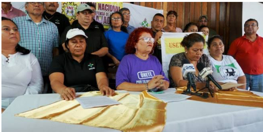
Sindicatos salvadoreños han expresado sus denuncias a la Organización Internacional del Trabajo (OIT) sobre la libertad sindical y la persecución al sindicalismo en El Salvador.