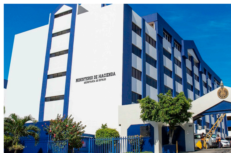
El Ministerio de Hacienda ha solicitado a la Asamblea Legislativa incorporar $118 millones sin detallar para qué serán utilizados por las instituciones.

Las declaraciones surgen en un contexto de debate sobre el papel de la Asamblea Legislativa y la concentración de poder político en El Salvador, un tema que continúa generando discusión entre partidos, analistas y diversos sectores de la sociedad de cara a futuros procesos electorales.