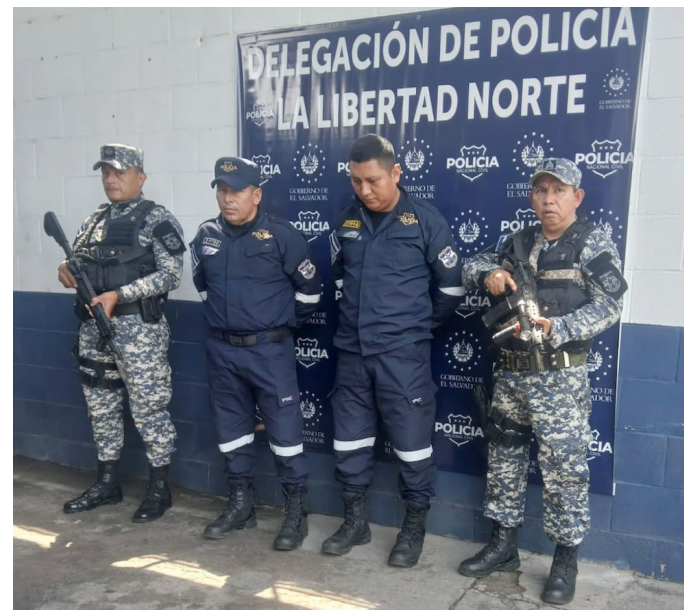
Estos son los agentes policiales de tránsito detenidos por exigir dinero a ciudadanos a cambio de devolverles las placas de sus vehículos.

Según se dice en la opinión pública no es primera vez que agentes de la PNC se ven involucrados en situaciones de este tipo. De hecho, con el régimen de excepción existen denuncias de policías que piden dinero a ciu-