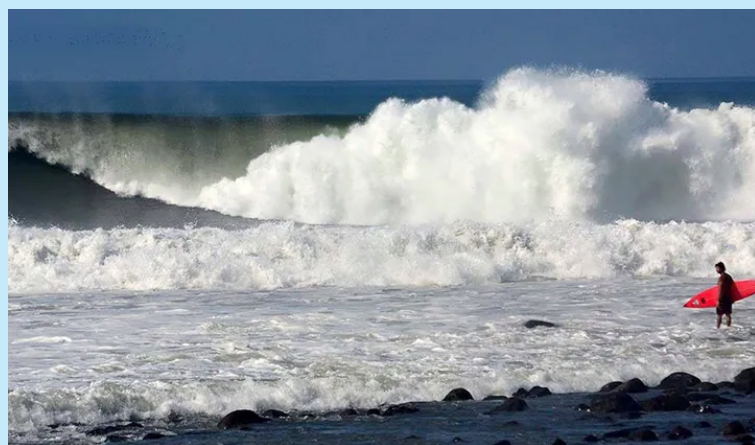
El fenómeno de mareas vivas se extenderá desde este lunes hasta el jueves 18 de junio, por lo que las autoridades recomiendan precaución durante actividades de pesca y recreación en las playas.

Lo anterior, según explicó el MARN, es debido a la alineación de la Luna con la Tierra y el Sol, fenómeno que coincide con la Luna Nueva y el Perigeo del 14 de junio. Durante esos días, el nivel del mar alcanzará rangos significativos: 3.6 metros en La Unión, 3.1 en El Triunfo, 2.4 en La Libertad y