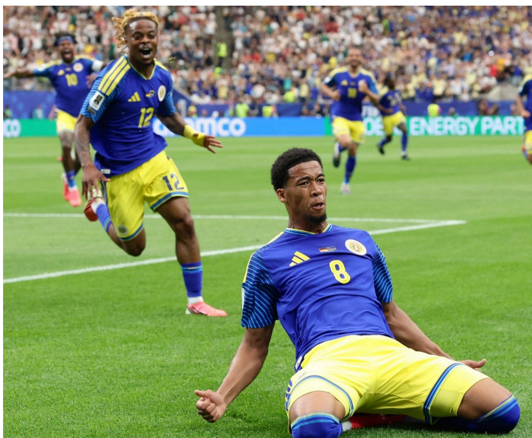
Curazao marca su primer gol en una cita mundialista ante Alemania, para el empate de 1-1.