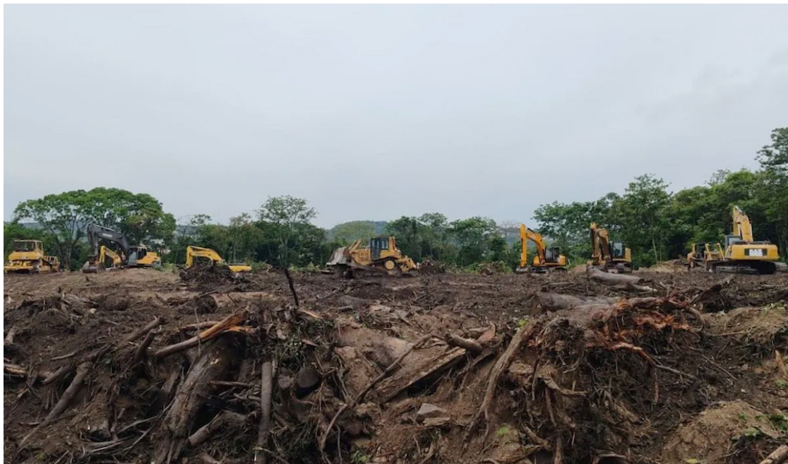
Así se dejó la zona de El Espino donde se construirá el CIFCO. El gobierno destruyó 8 manzanas de bosque.

Ricardo Navarro enfatizó que la causa no es política, sino social y ambiental, ya que a futuro el