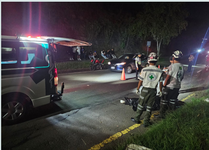
Cruz Verde atiende emergencia de tránsito sobre el Boulevard Luis Poma, Antiguo Cuscatlán, donde un motociclista perdió el control y falleció al instante.

dadanos para no ser capturados. También, se han documentado abusos de autoridades y agresiones por parte de efectivos policiales y militares durante esta medida.