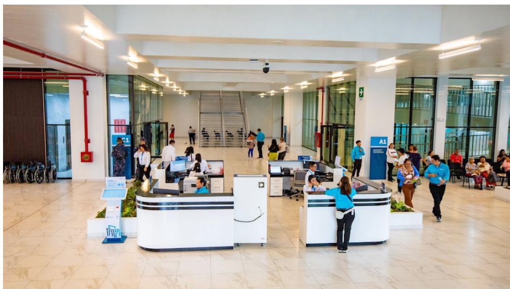
El Hospital Rosales fue inaugurado el uno de junio, en una cadena nacional donde Bukele tenía que rendir cuentas.

se vio tachada por los despidos masivos a finales de diciembre de 2025; según la Coordinadora Nacional para la Defensa de la Salud del Pueblo Salvadoreño (Conadesa) casi 2 mil trabajadores fueron despedidos.