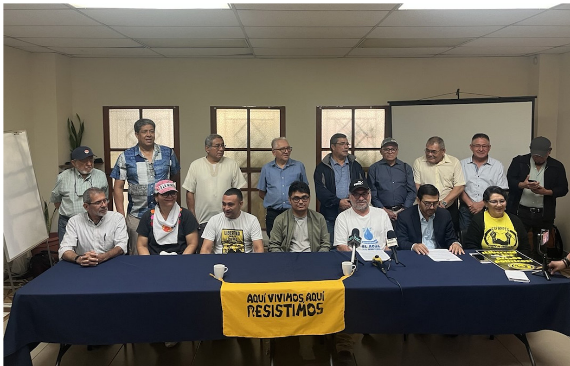
La Comunidad Santa Marta y organizaciones sociales se pronuncian sobre la absolucióndefinitiva de los líderes ambientalistas de Cabañas del delito penal. Esperan que los cuatros procesados que siguen con la responsabilidad civil le sean absueltos.