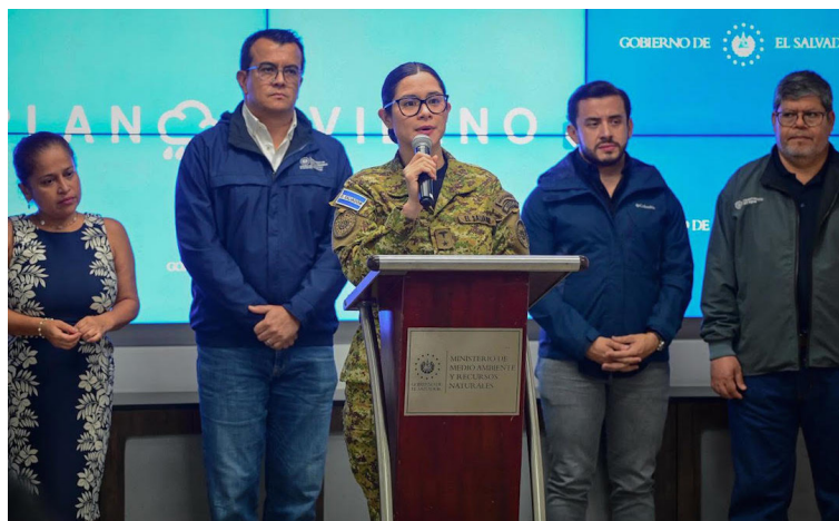
La ministra Karla Trigueros aseguró que el número de centros educativos afectados podría aumentar si persisten las lluvias. Foto Cortesía.

La institución brindó un balance sobre la situación de los centros educativos a raíz de las lluvias asociadas a la