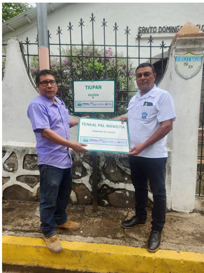
Representantes de PRO-VIDA y autoridades locales participaron en la entrega e instalación de nomenclatura bilingüe para promover la preservación del idioma náhuat.