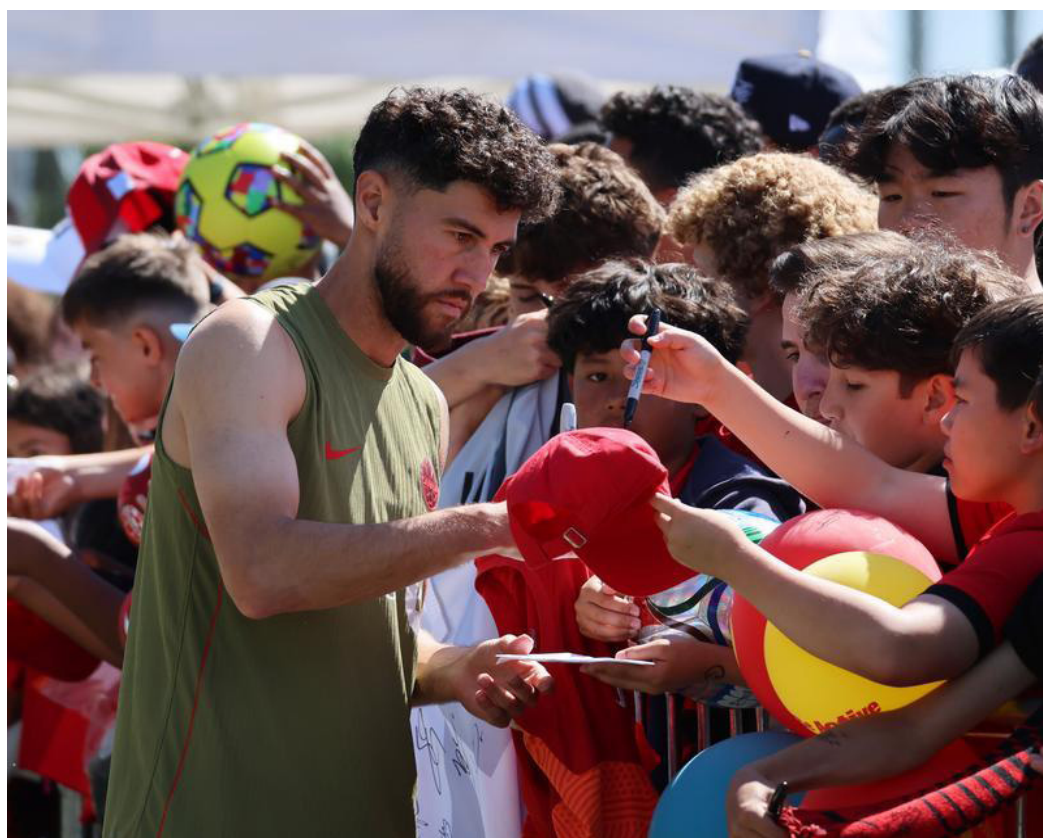
Jonathan Osorio, de la selección nacional canadiense de fútbol, firmando autógrafos a los aficionados antes de una sesión de entrenamiento previo a la Copa Mundial de la FIFA 2026, en Toronto, Canadá.