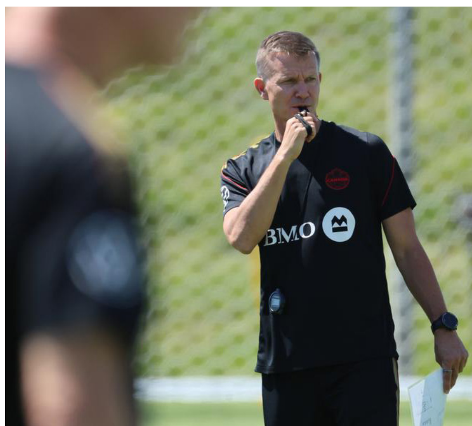
Director técnico Jesse Alan Marsch, de la selección nacional canadiense de fútbol, participando en una sesión de entrenamiento previo a la Copa Mundial de la FIFA 2026, en Toronto, Canadá.