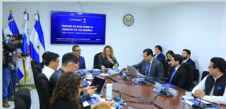
Este dictamen bajará al pleno este miércoles para ser aprobado por los legisladores.

El Tratado de Riad sobre el Derecho de los Diseños fue firmado por El Salvador el 31 de octubre de 2025 en la sede de la Organización Mundial de la Propiedad Intelectual. El decreto enviado por Cancillería señala que dicho instrumento internacional fue creado en la sede de la Organización Mundial de la Propiedad Intelectual (OMPI), ubicada en la ciudad de Ginebra, Suiza.