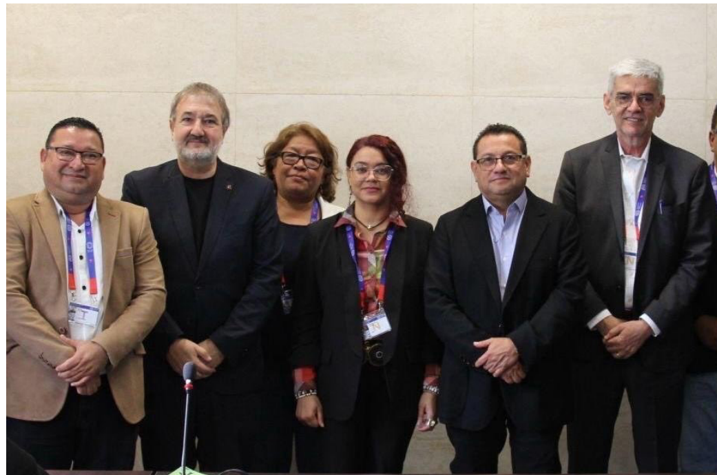
Fotografía compartida por el ministro de Trabajo, Rolando Castro con representantes de la Confederación Sindical de las Américas y la Confederación Sindical Internacional.

“Estas declaraciones, de ser ciertas, constituyen una grave afrenta y una burla para miles de trabajadores salvadoreños que durante los últimos años han sufrido despidos antisindicales, persecución política, ne-