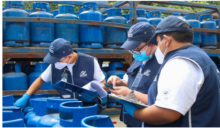
Esta prórroga será aprobada este miércoles en la sesión plenaria; sus efectos serán por un año.

En caso de no atender la instrucción de interrumpir la salida de vehículos durante una inspección, o no envasar el contenido