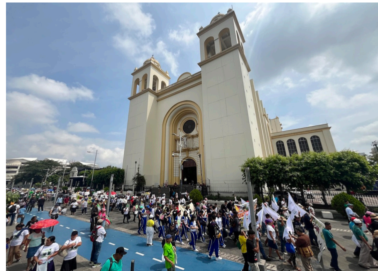
Este año, en lugar de ir a la Asamblea Legislativa, la Caminata Ecológica culminó en la Plaza Libertad, frente a la Iglesia El Rosario con actos culturales.

En ese sentido, la Caminata Ecológica hizo un llamado para construir un camino de diálogo, justicia y respeto por la vida.