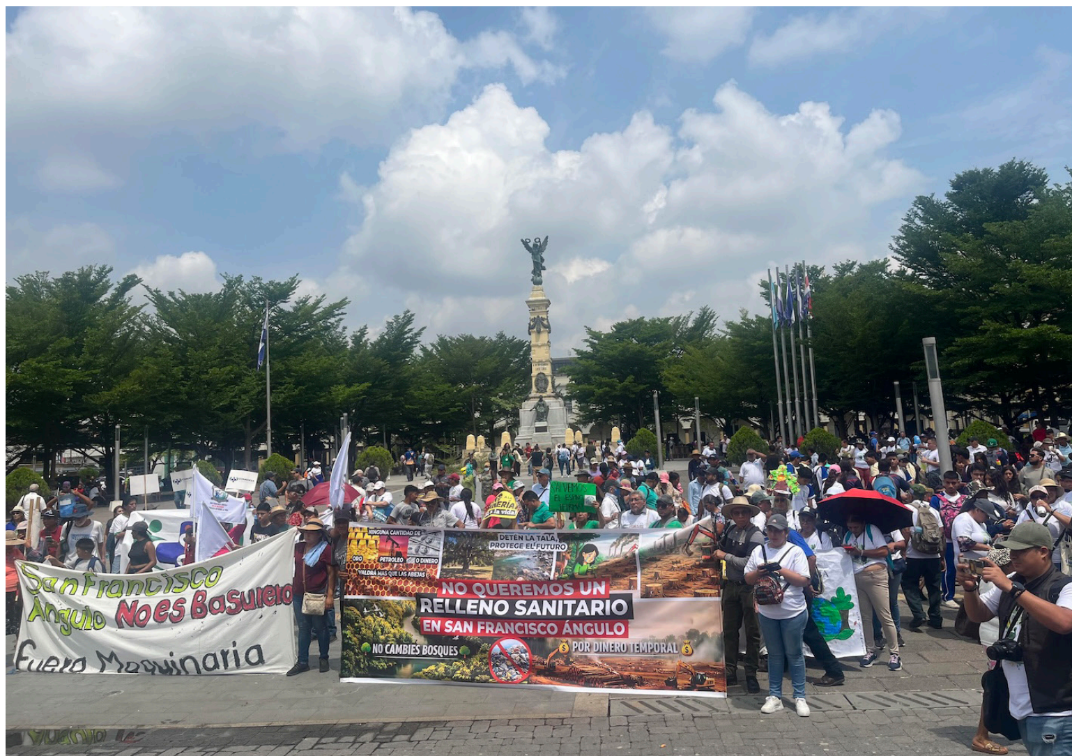
CAMINATA ECOLÓGICA. LA PLAZA LIBERTAD, FRENTE A LA IGLESIA EL ROSARIO, FUE EL PUNTO DE LLEGADA DE LA CAMINATA ECOLÓGICA QUE AÑO CON AÑO SE REALIZA EN EL CONTEXTO DEL DÍA MUNDIAL DEL MEDIOAMBIENTE, CON EL OBJETIVO DE DEFENDER EL BIEN COMÚN, ES DECIR LA NATURALEZ, LA MADRE TIERRA. LA XXVI CAMINATA ECOLÓGICA FUE DENOMINADA “CONCIENCIA QUE CAMINA, COMPROMISO QUE TRANSFORMA” EN LA QUE SE EXIGIÓ EL RESPETO A LOS TERRITORIOS Y LA PROHIBICIÓN DE LA MINERÍA METÁLICA.