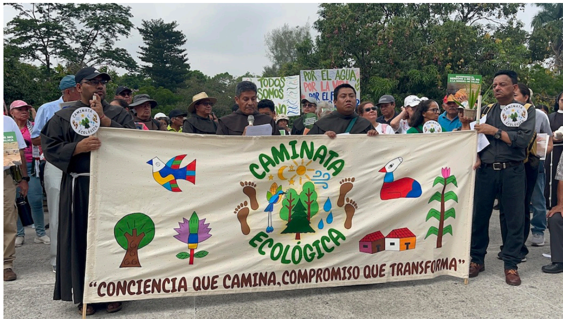
La Caminata Ecológica es una expresión popular para instar a la sociedad a cuidar el bien común.