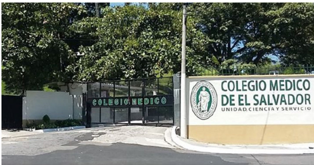
El Colegio Médico de El Salvador reconoció la importancia del nuevo Hospital Rosales, pero advirtió que persisten desafíos estructurales en el sistema de salud.