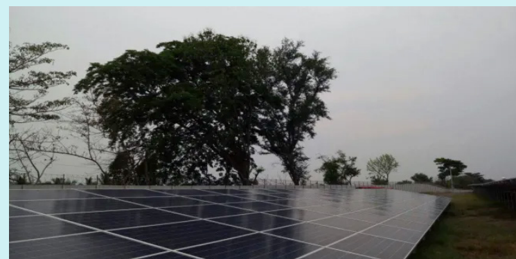
La iniciativa será estudiada el lunes en la Comisión de Hacienda.

De momento, la Asamblea Legislativa le ha aprobado en lo que va de 2026, siete préstamos al Gobierno que totalizan $1,051.7.