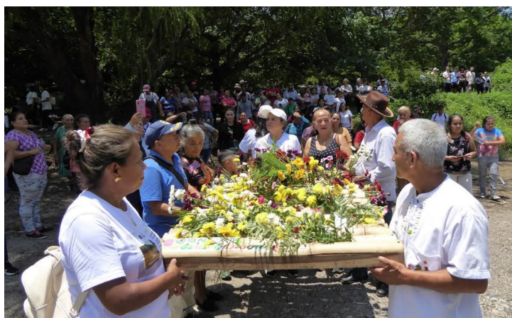
Sobrevivientes, familiares de personas desaparecidas y organizaciones de derechos humanos conmemoraron el 44.º aniversario de la Guinda de Mayo en la ribera del río Sumpul, en Chalatenango.

Saúl Méndez @DiarioCoLatino / Colaborador