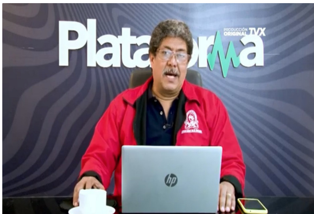
El docente universitario asegura que persiste la deuda de Bukele en la solución a la problemática económica que enfrenta la población.

No obstante, cuestionó que estos proyectos beneficien principalmente a inversionistas privados y sectores con mayor capacidad económica, mientras excluyen a amplios sectores de la población. “El problema es que en ese modelo no caben los