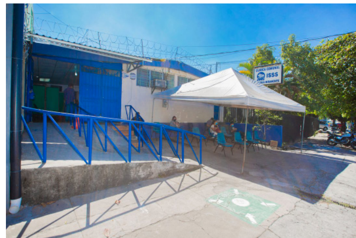
CONADESA advierte que una ampliación de horarios sin planificación adecuada podría afectar tanto a pacientes como a trabajadores de la salud.

“La salud de la población no puede depender de anuncios ni de especulaciones. Se requieren planes reales, metas claras y recursos suficientes para garantizar una atención oportuna, segura y de calidad”, afirmó la orga-