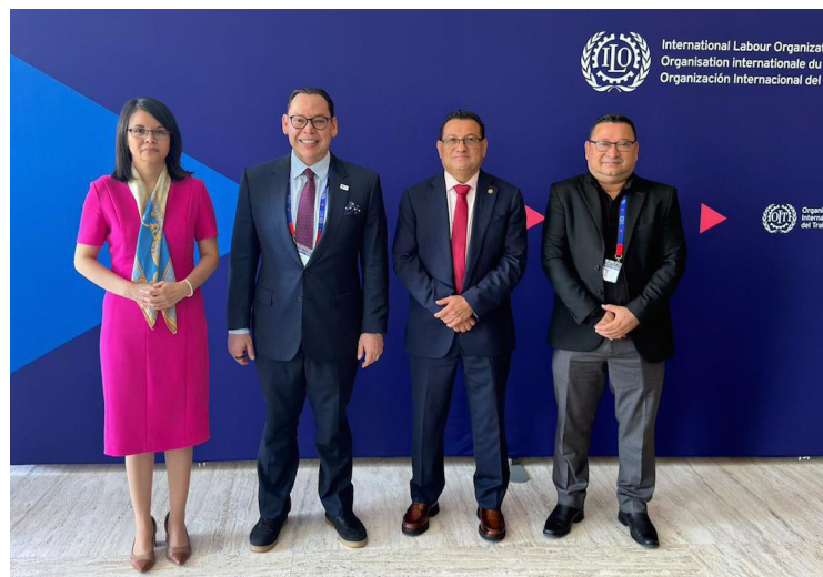
Comitiva de El Salvador en la Conferencia de la OIT.

Según destacó el Ministerio de Trabajo, “la permanencia en esta lista representó, durante años, un desafío para la imagen del país ante la comunidad internacional, al mantener un nivel especial de observación sobre aspectos laborales. Por ello, la salida de El Salvador constituye una señal de confianza y un reconocimiento a los esfuerzos realizados para fortalecer las relaciones laborales y consolidar una cultura de cumpli-