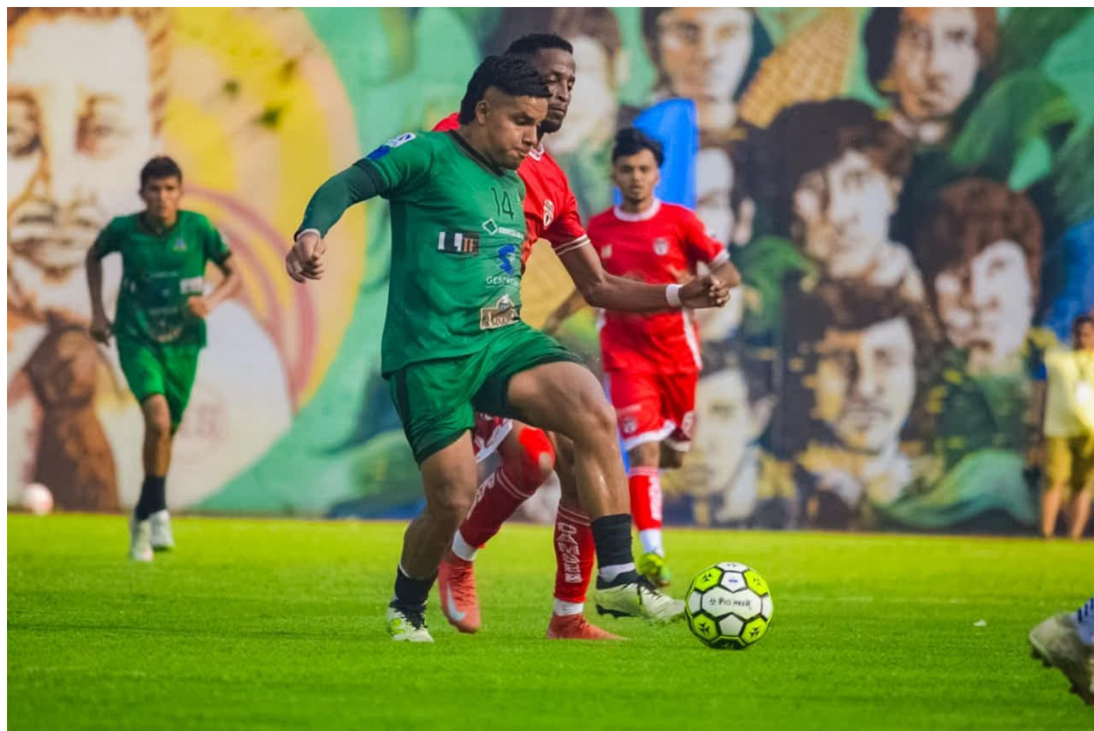
INCA Aruba asciende a Primera División tras vencer a Atlético Balboa desde penales.