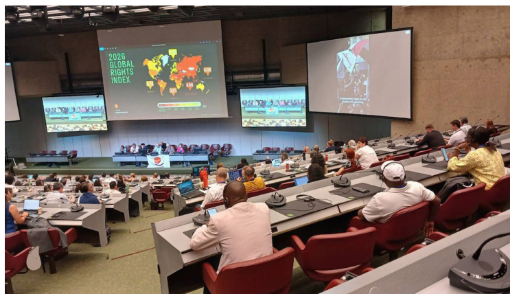
El CROSS afirmó que la exclusión de El Salvador de las listas de la OIT no pone fin a las denuncias por vulneraciones laborales.

“Los países incluidos en la lista corta de la región fueron Argentina, Colombia, Panamá y Uruguay. No obstante, la Comisión de Libertad de Asociación de la OIT tiene conocimiento de la situación que enfrentan los trabajadores del sector público salvadoreño y se espera que realice un proceso de seguimiento du-