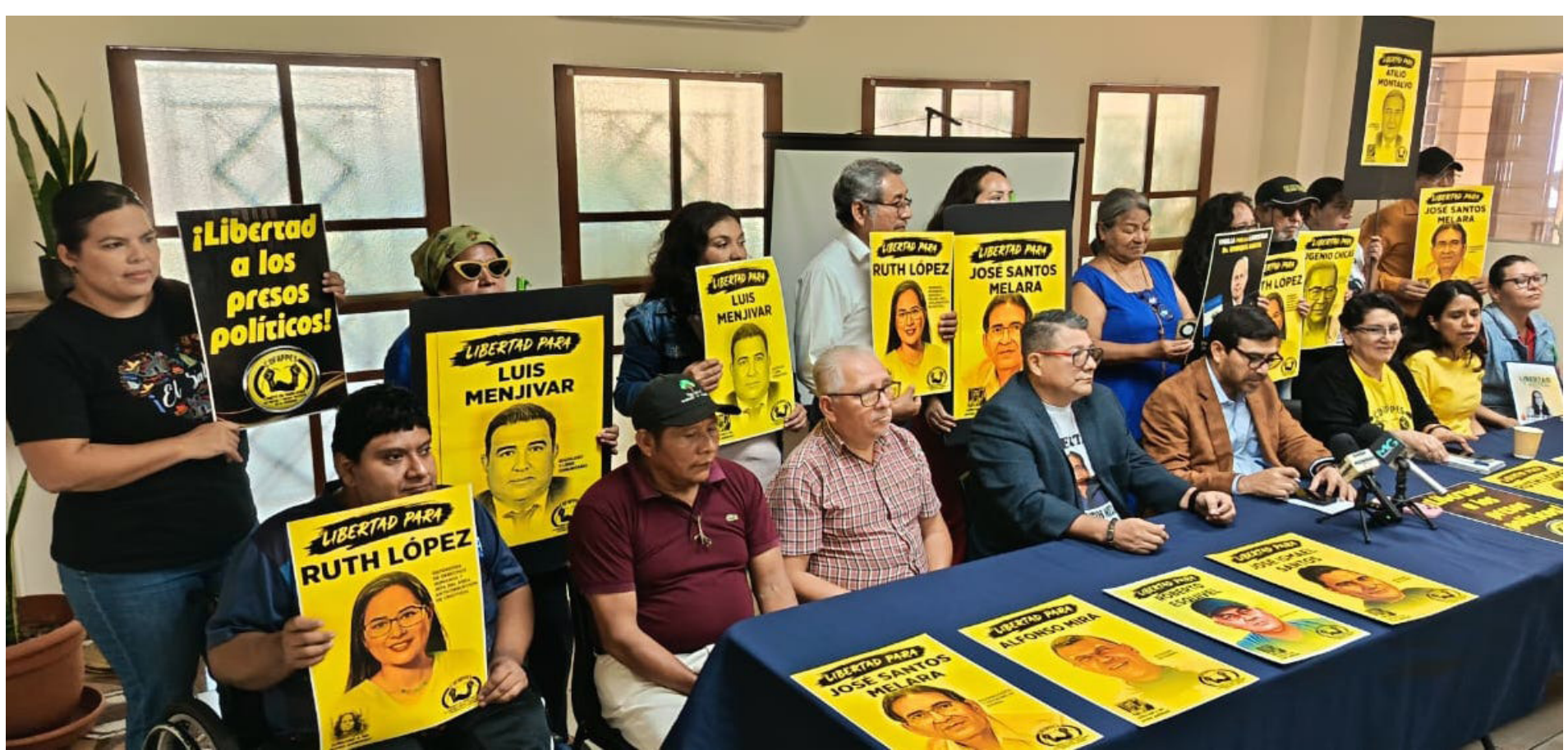
ORGANIZACIONES DENUNCIAN ESCALADA DE ACOSO, PERSECUCIÓN. ORGANIZACIONES SOCIALES DEFENSORAS DE DERECHOS HUMANOS Y LABORALES ALZAN LA VOZ ESTE ESTE MARTES PARA DENUNCIAR EL ALARMANTE INCREMENTO DE LA PERSECUCIÓN POLÍTICA, EL ACOSO INSTITUCIONAL Y LA VULNERACIÓN SISTEMÁTICA DEL DEBIDO PROCESO EN EL PAÍS.