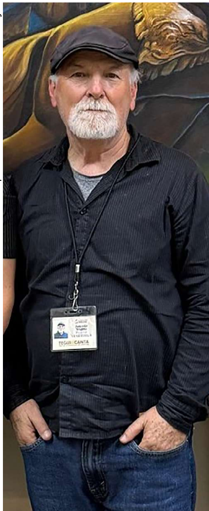
El poeta venezolano Antonion Trujillo.