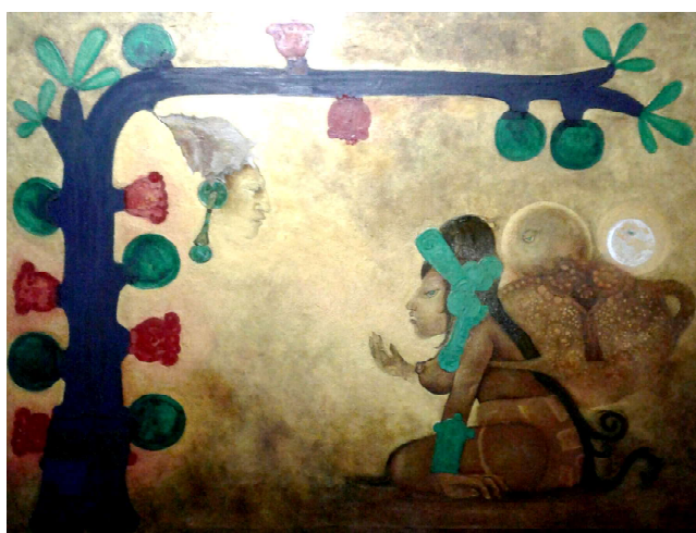
Cabe destacar que su encuentro con la cultura ancestral sería parte importante de su formación como antropólogo

Con apenas 16 años, el humilde jovencito llegado del occidente del país, se inscribió en el nuevo proyecto de educación artística impulsado por la reforma educativa de Walter Béneke. Desde su llegada al CENAR Edgardo