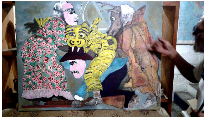
Su oficina siempre estuvo repleta de todo tipo de materiales didácticos donados por los amigos extranjeros; libros, material educativo, material de investigación, información, y siempre sin faltar un buen café.

Su labor curricular incluye la promoción de artes a nivel estudiantil, el rescate de artesanías y artes populares, investigaciones en botánica, flora, fauna, antropología y arqueología, química del color, aves nacionales, etc. Como profesor dictó muchas charlas en centros educativos y universidades y gestionó con los países amigos; un millar