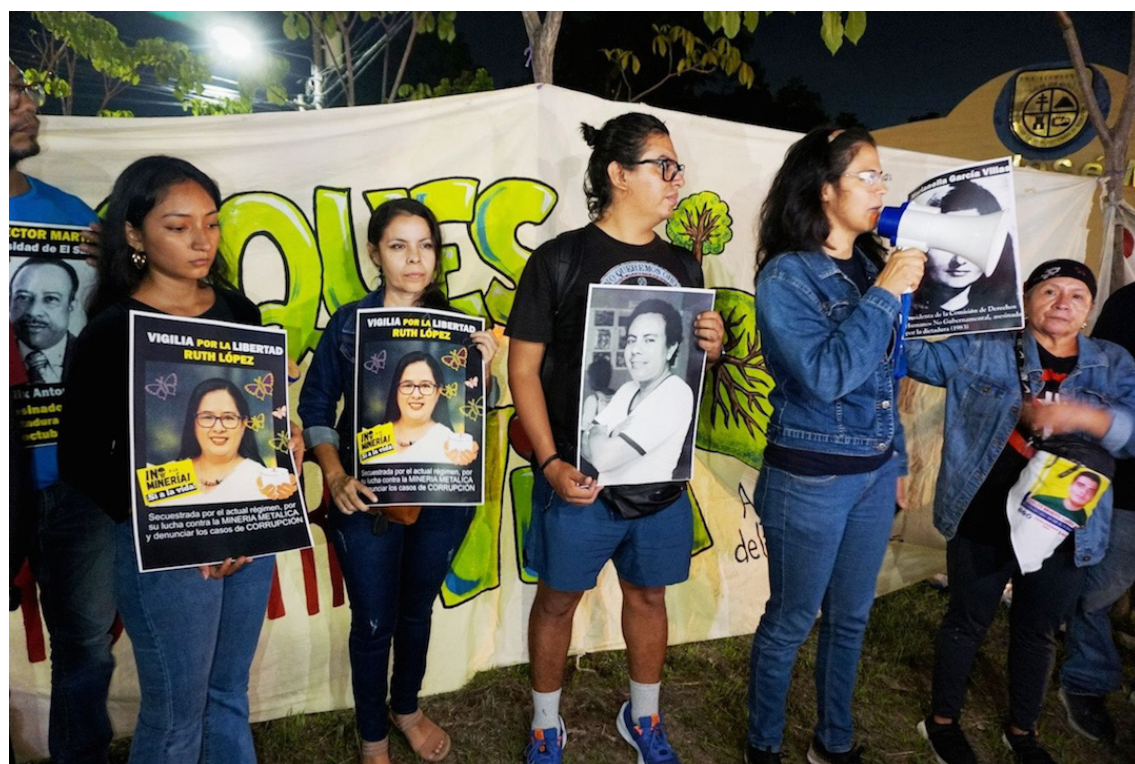
Durante la 126ª vigilia, los participantes denunciaron restricciones de acceso a la zona intervenida y cuestionaron que sus demandas no hayan sido atendidas por las autoridades.

“Para nosotros es la misma lucha, porque todos los territorios están ecológica, biológica e incluso espiritualmente interconectados. Sentimos esa conexión y esta noche estamos de luto por esta gran pérdida para la población salvadoreña”, concluyeron.