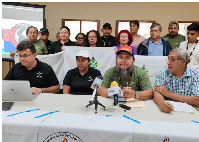
MILPA El Salvador denuncia las políticas extractivistas y la destrucción sistemática del medioambiente en el país.

Los sindicatos y colectivos presentes manifestaron de forma contundente su rechazo unánime a la depredación ambiental, denunciando que los discursos estatales de seguridad energética y