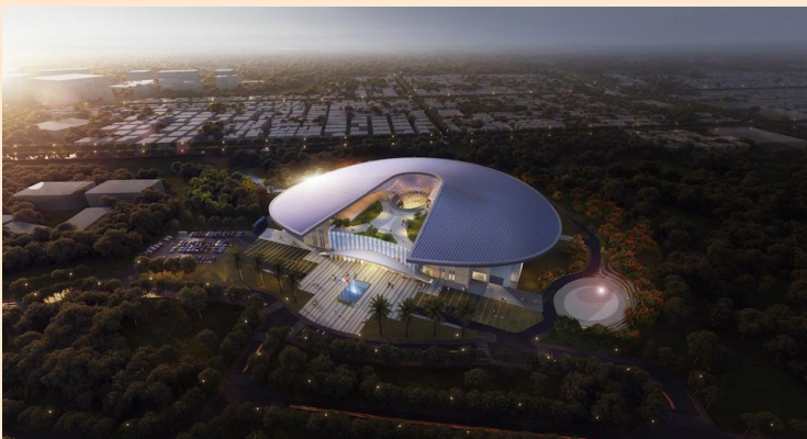
Maquetación del CIFCO que sería construido por la República Popular China.

El Ministerio de Obras Públicas (MOP) dijo que el CIFCO “no se construirá” en la Finca El Espino. Sin embargo, en el decreto aprobado en julio del año pasado por el oficialismo sí establece que el terreno pertenece a la Finca El Espino; por lo que se contradicen (ver nota aparte).