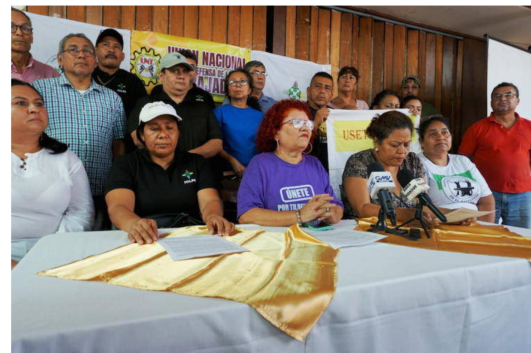
La UNT y otras organizaciones sindicales pidieron a la comunidad internacional mantener vigilancia sobre la situación laboral y sindical del país.

Saúl Méndez @DiarioCoLatino / Colaborador