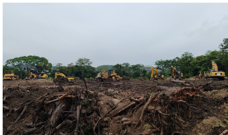
El Espino: El MOP ya inició con la deforestación en la zona donde se pretende construir el CIFCO, a pesar de los problemas medioambientales que ocasionará.

Por ejemplo, plantean que la construcción del CIFCO en El Espino derivaría en inundaciones y catástrofes naturales, la pérdida de biodiversidad. “El mayor argumento son los animales que encuentran en El Espino, su hogar. El hecho de que estos animales pierdan su hogar va a generar desplazamientos hacia zonas ur-