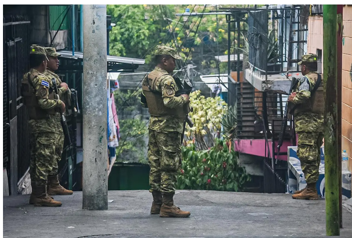
La Fuerza Armada apoya en tareas de seguridad pública junto con elementos de la PNC.