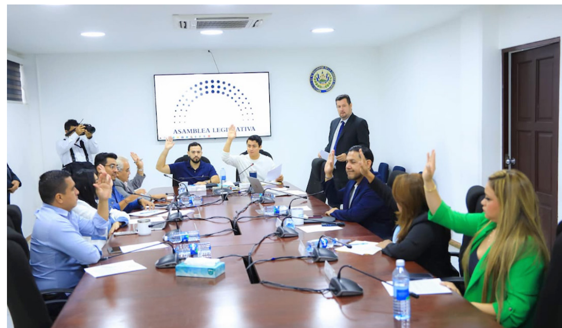
Comisión de Hacienda vota a favor de asignar más de 40 millones a diversas instituciones del Estado.

Es de contextualizar que en enero de este año; la Asamblea ratificó el Contrato de Préstamo No. 6073/OC-ES con el Banco Interamericano de Desarrollo (BID) por un monto de $195 millones, destinados a financiar el Programa de Modernización del Aeropuerto Internacional de El Salvador, con el objetivo de ampliar y mejorar la infraestructura aeroportuaria del país. De acuerdo con la Cláusula 4.01 del contrato, la CEPA será el organismo ejecutor responsable de llevar adelante el proyec-