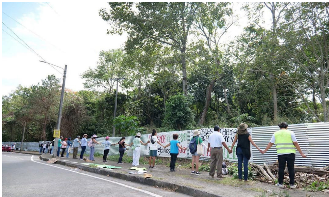
La iniciativa ciudadana ya acumula más de medio millón de apoyos entre firmas físicas y digitales.

“La campaña que hemos impulsado consideramos que ha sido un éxito porque es una iniciativa 100 % ciudadana. No tenemos ningún vínculo con partidos políticos y lo que estamos solicitando,