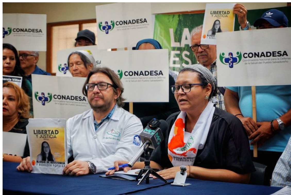
Durante la conferencia de prensa, organizaciones denunciaron un aumento de la criminalización contra defensores de derechos humanos, sindicalistas y periodistas.

Asimismo, organismos internacionales y expertos de Naciones Unidas expresaron preocupación por las condiciones de detención y la prolongación del encarcelamiento de López, al señalar la necesidad de garantizar el debido proceso, la presunción de ino-