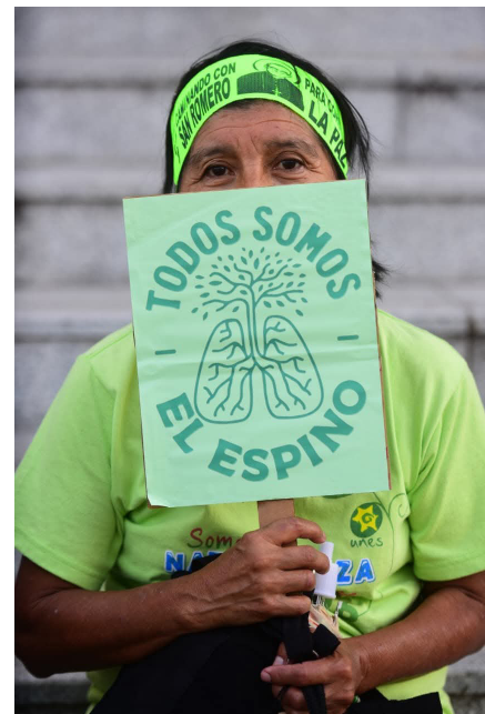
Integrantes de Somos El Espino aseguran que la campaña no tiene vínculos político-partidarios.

“Queremos ampliar el área protegida y reducir la urbanizable para que el ecosistema se mantenga en condiciones óptimas y no continúe siendo intervenido por proyectos públicos o privados. Amamos los espacios verdes y soñamos con un El Salvador que tenga a la naturaleza como prioridad. La naturaleza es nuestro protector silencioso, y aquí estamos sumando nuestra voz por