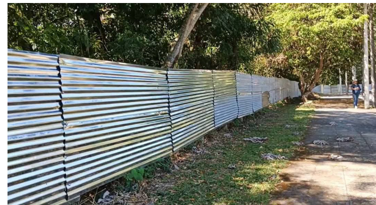
El colectivo sostiene que la protección de El Espino es clave para la recarga hídrica y el equilibrio ambiental.

“Tenemos muchas ideas en mente, pero de momento queremos concentrar todos nuestros esfuerzos en el ámbito digital. Les invitamos a seguir nuestras redes sociales para conocer las próximas actividades. Estamos en TikTok, Instagram, Facebook y X como SOMOS EL ESPINO”, concluyó el movimiento.