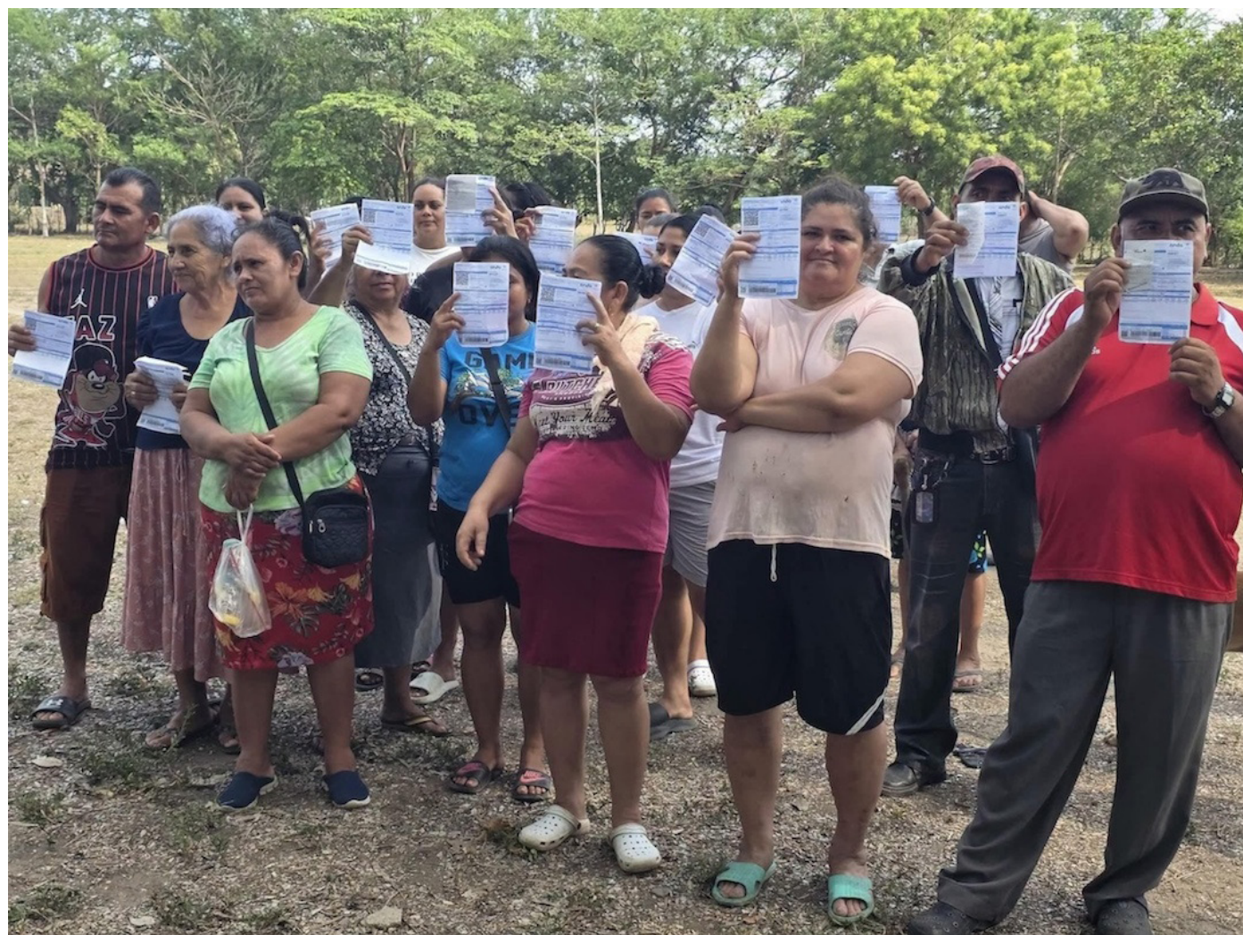
Habitantes de Santa Cruz Porrillo denunciaron que los recibos de agua han incrementado hasta alcanzar montos de $600.

“La población tiene derecho a salud, educación y agua. ¿Por qué les van a quitar ese derecho? Solo Dios puede quitar ese derecho y nadie más. Eso es lo que nosotros pedimos y exigimos”, concluyeron.