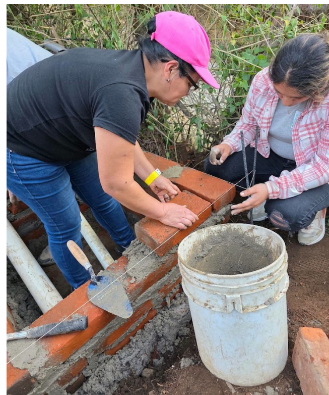
PRO-VIDA informó sobre iniciativas de empoderamiento femenino y fortalecimiento de capacidades en comunidades de Chalatenango y Cuscatlán Norte.

Según detalló PRO-VIDA, finalizaron con éxito los talleres de autocuidado para grupos vulnerables, desarrollados en coordinación con la Unidad de Cuidados Paliativos del Hospital Nacional de Ilobasco.