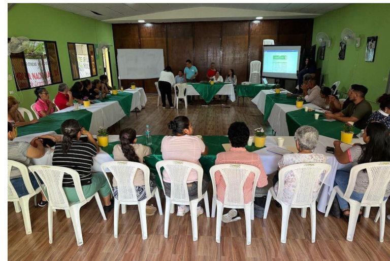
Durante la Asamblea, PRO-VIDA destacó proyectos de agroecología, acompañamiento socioemocional y acceso al agua en comunidades vulnerables.