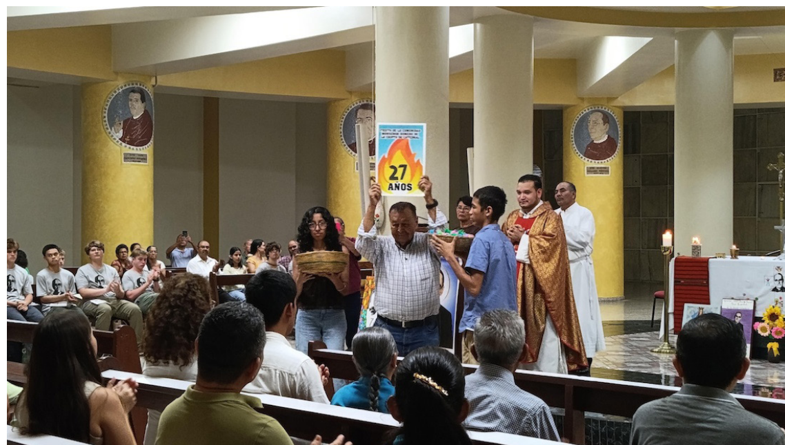
La Comunidad de la Cripta nació el 23 de mayo de 1999 con el objetivo de mantener viva la palabra de Monseñor Romero.

“Monseñor Romero afirmó que los bautizados necesitamos la fuerza del Espíritu Santo para encarnar el espíritu de renovación de Cristo. Presentamos el pan y el vino, que pronto serán convertidos en el Cuerpo y Sangre de Cristo, para que al comulgarlo seamos renovados con la fuerza de su Santo Espíritu”, concluyeron.