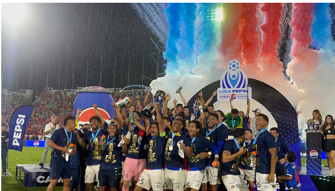
FAS levanta la Copa del Clausura 2026 tras vencer 3-0 a Águila en el estadio "Mágico" González.