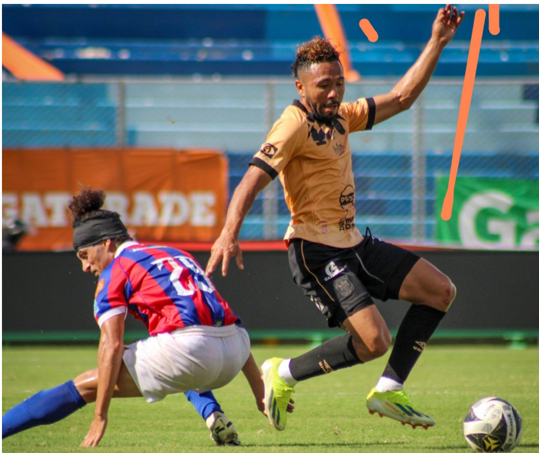
Águila y FAS protagonizaron un clásico nacional en una final después de 17 años de la última.