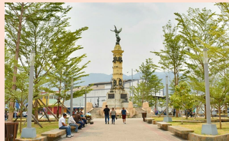
En el decreto no menciona los sitios donde se colocarán el internet. Solo menciona que serán en 440 sitios del país.

El decreto establece que los recursos servirán para financiar el servicio de conectividad de banda ancha de 440 sitios públicos durante el periodo comprendido entre julio y octubre del presente año, “y para la implementación de programas de for-