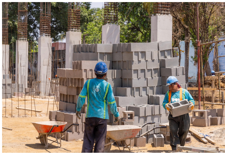
La DOM sustituyó a las alcaldías referente a la construcción de obras en los territorios.

El decreto plantea que la DOM disponga de 8 millones provenientes de préstamos externos del Banco Interamericano de Desarrollo (BID). De dicho monto se asignarán $5 millones al “Programa de Construcción y Mejoramiento de