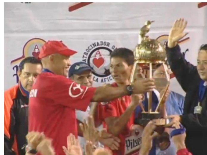
FAS levanta la copa del torneo Apertura 2009 tras vencer 3-2 a Águila en el Cuscatlán.

En esta temporada, En los cuartos de final, Águila eliminó a Alianza Fútbol Club, mientras que FAS dejó en el camino a Cacahuatique. Ya en semifinales, los emplumados despidieron al actual campeón, Club Deportivo Luis Ángel Firpo, y los tigrillos hicieron lo propio frente a Municipal Limeño.