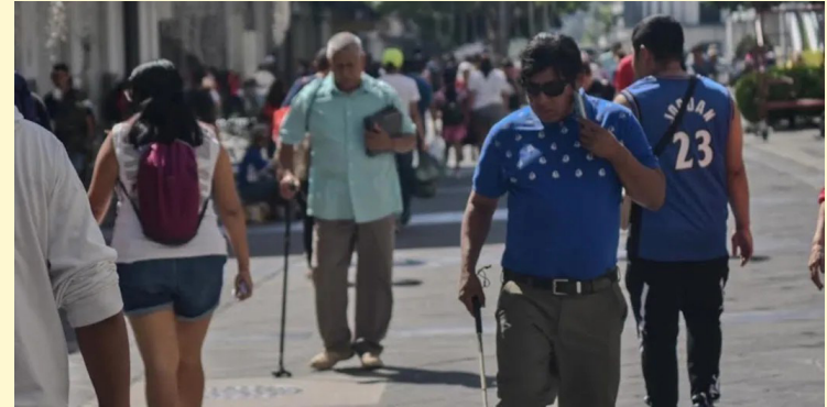
El dinero proviene de los extintos Consejo Nacional para la Inclusión de las Personas con Discapacidad (CONAIPD), del Consejo Nacional Integral de la Persona Adulta Mayor (CONAIPAM), así como del Ministerio de Desarrollo Local.

Entre las acciones contempladas se encuentra el fortalecimiento de la infraestructura física de las aduanas a nivel nacio-