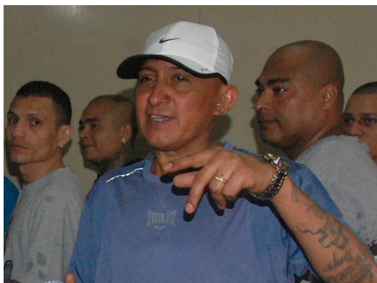
El cabecilla de la Pandilla 18 falleció la noche del miércoles en prisión, según informó la cuenta institucional de Centros Penales.

La dirección añadió que los informes clínicos detallan que padecía cirrosis hepática, síndrome hepatorre-