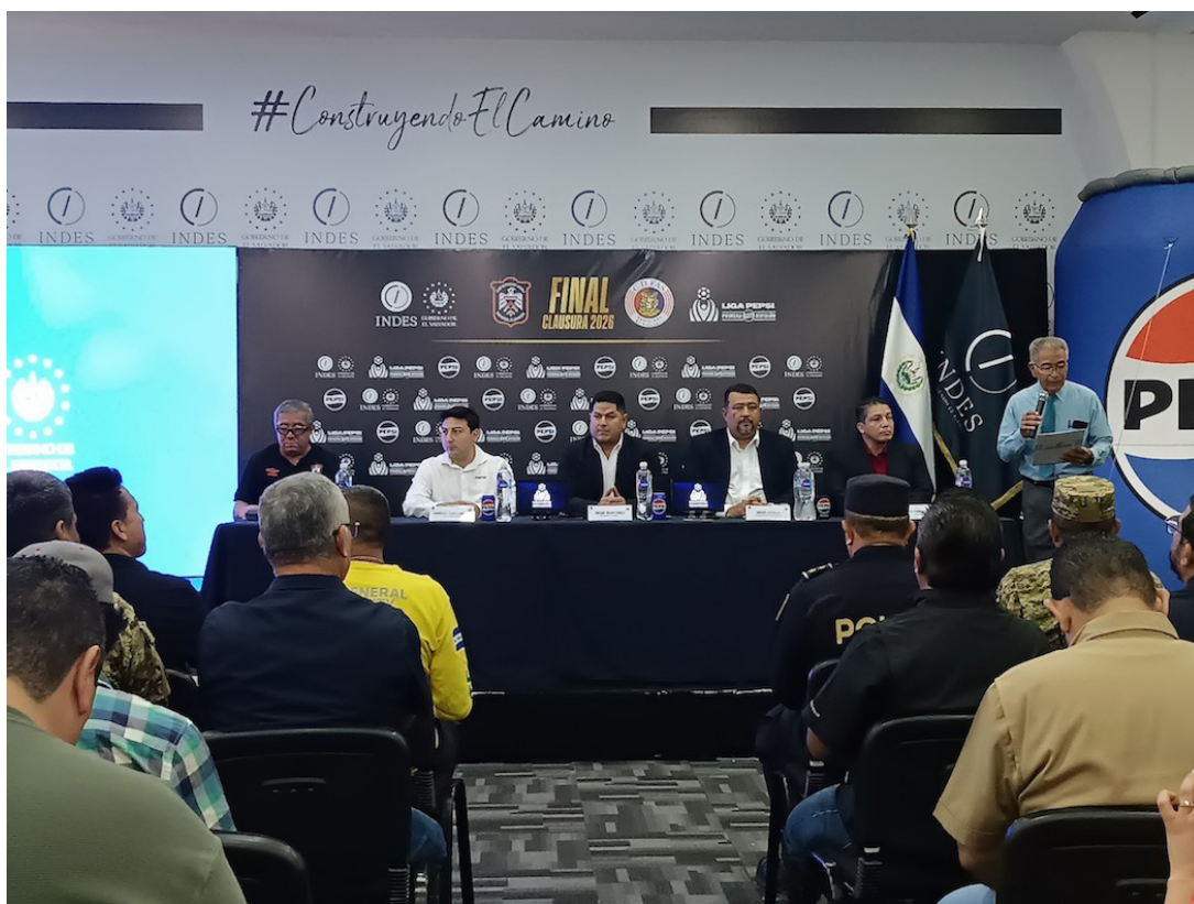
Primera División brinda detalles de logística para la final del Clausura 2026 entre FAS y Águila en el estadio "Mágico" González.