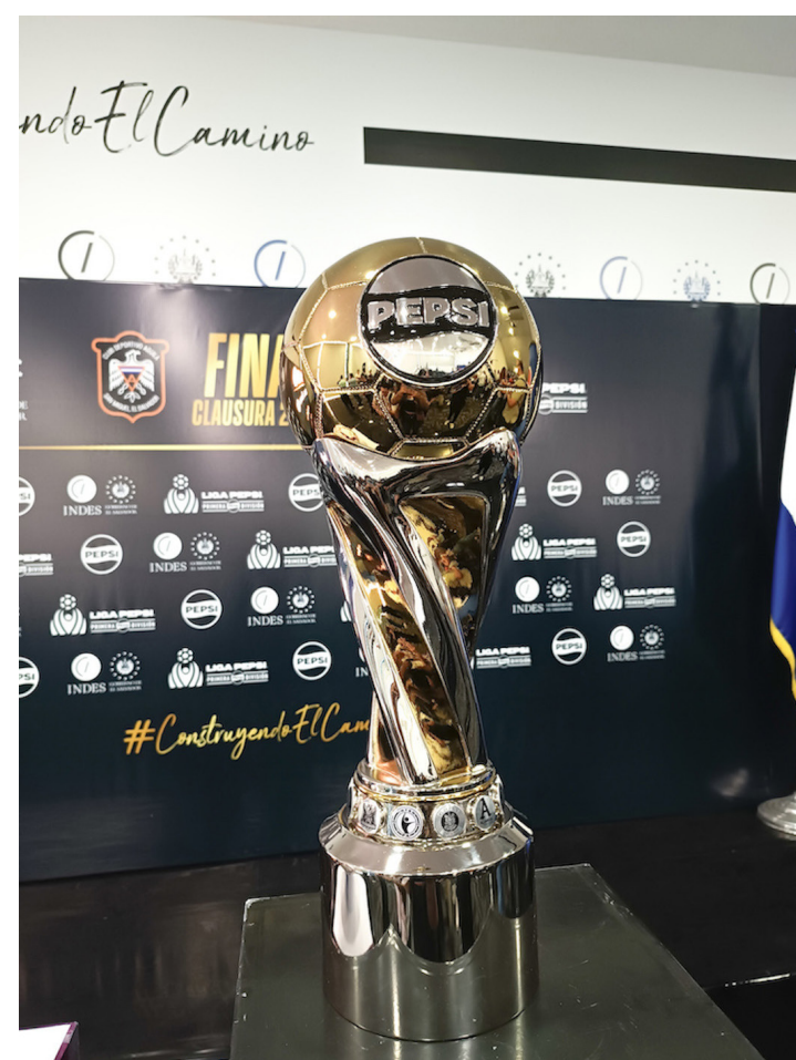
Copa del torneo Clausura 2026 para la final entre Águila y FAS.

Para ese día también se contará con una flota de grúas para remolcar vehículos pesados y livianos operadas por gestores de tránsito del VMT, para atender cualquier circunstancia que se presente en el evento.