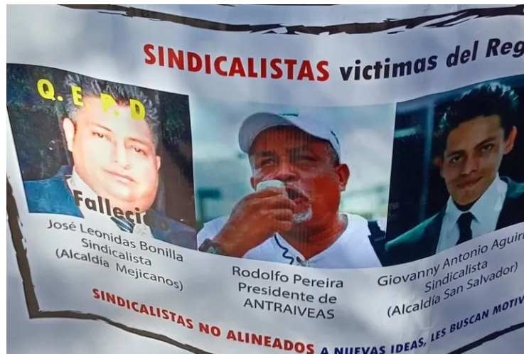
El Colectivo de Sindicalistas en el Exilio pidió que El Salvador se mantenga en la lista corta de la OIT, ante las violaciones a la libertad sindical y la criminalización de dirigentes.

El pronunciamiento cita el 412.º Informe del Comité de Libertad Sindical de la OIT, emitido en noviembre de 2025, en el que el organismo calificó la situación salvadoreña como un asunto “grave y urgente”. Según el informe, las condiciones actuales afectan “la libertad de acción de un movimiento sindical en su conjunto”.