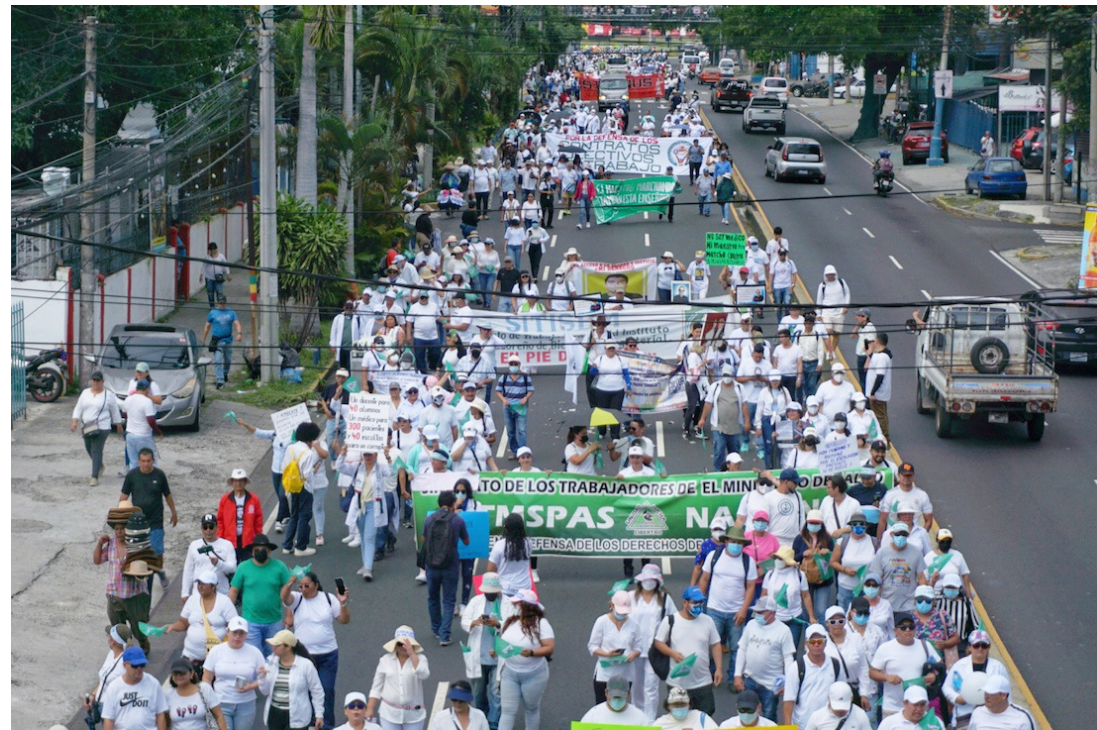
Vásquez sostuvo que el Gobierno ha destinado cientos de millones de dólares a telemedicina mientras persisten carencias en medicamentos, infraestructura y personal médico. Foto Diario Co Latino / Saúl Méndez

Saúl Méndez @DiarioCoLatino / Colaborador