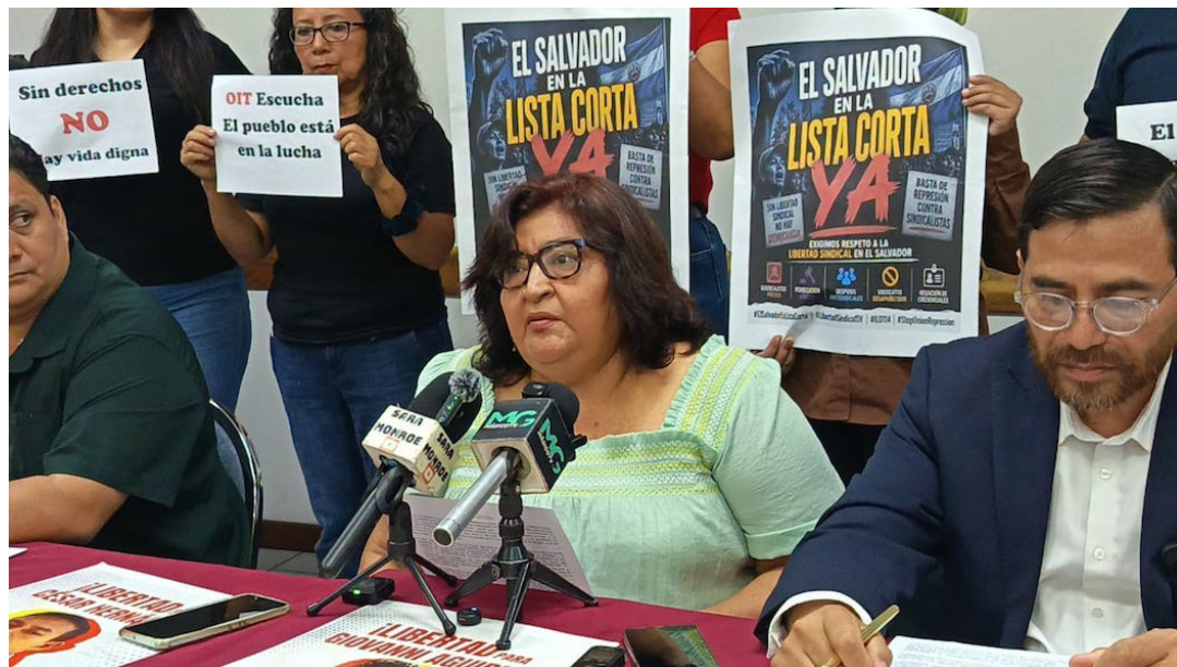
El MDCT sostiene que la OIT debe mantener a El Salvador en su lista de países que incumplen medidas a favor de los trabajadores. Denuncian más de 62,000 despidos y la eliminación de al menos 60 sindicatos.

La denuncia del MDCT trasciende las demandas netamente administrativas o económicas para adentrarse en el terreno de las violaciones a los derechos humanos y a la integridad física. El informe revela una sistemática criminalización de la protesta y del disenso, que se traduce en el encarcelamiento y la persecución penal de defensores de los derechos de los trabajadores.