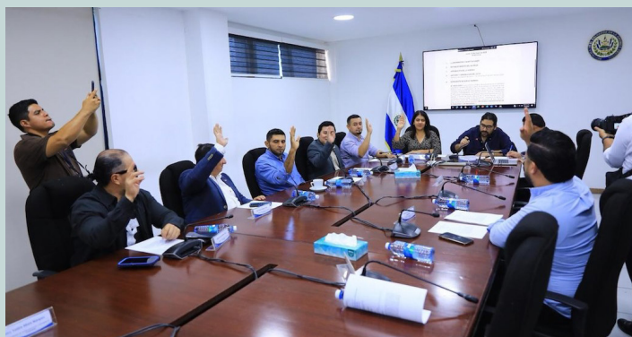
Comisión dictamina a favor de reformar ley para incluir la legalización de terrenos en la Comunidad 2 de noviembre.