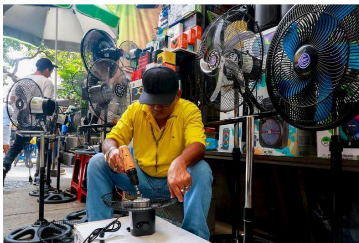
Un comerciante ensambla un ventilador en un puesto durante una ola de calor, en el centro de Guayaquil, Ecuador, el 21 de abril de 2026.

Soares señaló que no es posible hablar de resiliencia climática sin considerar los pilares de mitigación, adap-