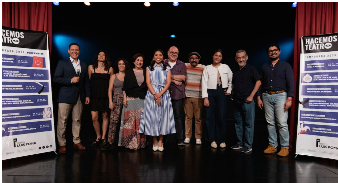
Teatro Luis Poma presenta el Acto 2 de la temporada 2026; son 6 obras de teatros que serán presentadas desde mayo al 5 de julio.