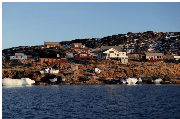
Imagen del 8 de febrero de 2026 del paisaje cerca de Nuuk, Groenlandia, territorio autónomo de Dinamarca.

Nielsen hizo los comentarios en una breve rueda de prensa en Nuuk luego de reunirse con el enviado especial de Estados Unidos para Groenlandia, Jeff Landry, y el embajador estadounidense en Dinamarca, Kenneth