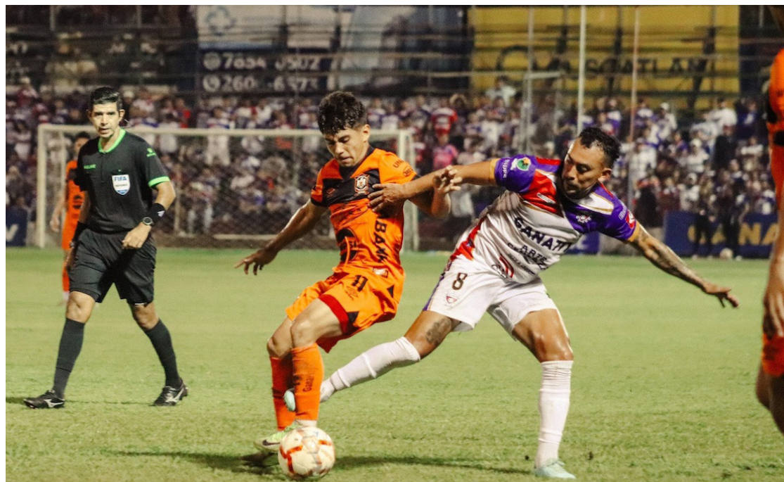
Águila elimina en semifinales a Firpo, en la tanda de penales, y se confirma como primer finalista del Clausura 2026.

El CD Águila se convirtió en el primer finalista del torneo Clausura 2026 tras imponerse en la tanda de penales a Luis Ángel Firpo en el estadio Sergio Torres Rivera de Usulután. El conjunto emplumado sacó provecho de su efectividad desde los once pasos y de la destacada actuación del