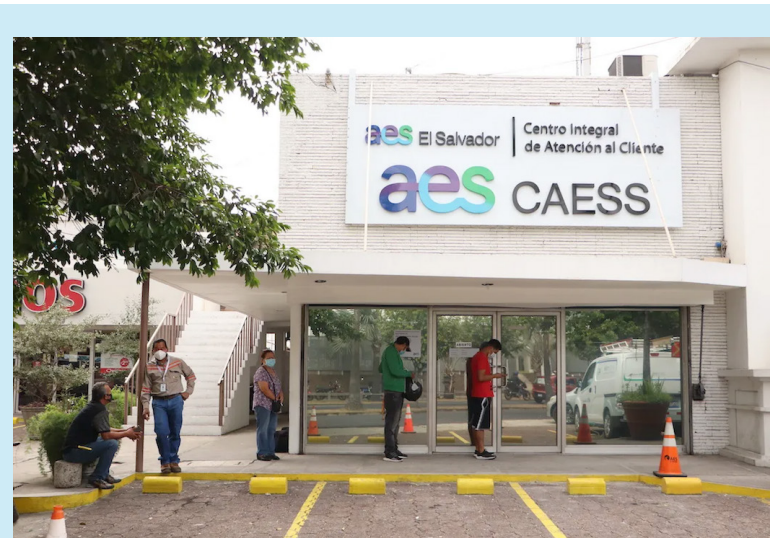
AES informa que dará saldo a favor a todas aquellas personas que le salieron montos elevados en la factura de mayo.

le va a fortalecer, Dios le va a indicar el camino por donde debe andar”, puntualizó el padre. El religioso concluyó haciendo un llamado a los feligreses: “permitámosle al Señor que camine a nuestro lado, así como caminó junto a los discípulos”.