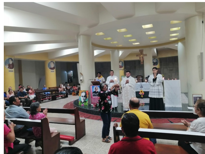
En la procesión de ofrendas, la Comunidad de la Cripta presentó un cirio encendido para iluminar el camino de la verdad, que simboliza la energía de Jesús que siempre ilumina.

Es entonces que Flores enfatizó que, en todo este camino, El Señor no nos deja solos. “No es-