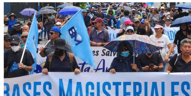
Educadores denunciaron decisiones arbitrarias y falta de planificación en la distribución de paquetes escolares durante 2026.

“Recordamos al Director Departamental de Chalatenango lo dispuesto en el artículo 2 de nuestra Constitución de la República, que garantiza el derecho fundamental a la integridad fisi-