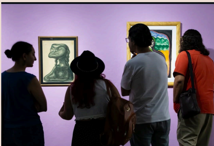
La muestra reúne 14 pinturas al óleo, grabados restaurados, dibujos y archivos personales del reconocido artista salvadoreño.

los educadores a riesgos innecesarios. “Exigimos el cese inmediato de estas prácticas arbitrarias y el respeto irrestricto a la dignidad, la seguridad y los derechos constitucionales de los docentes salvadoreños”, concluyó.