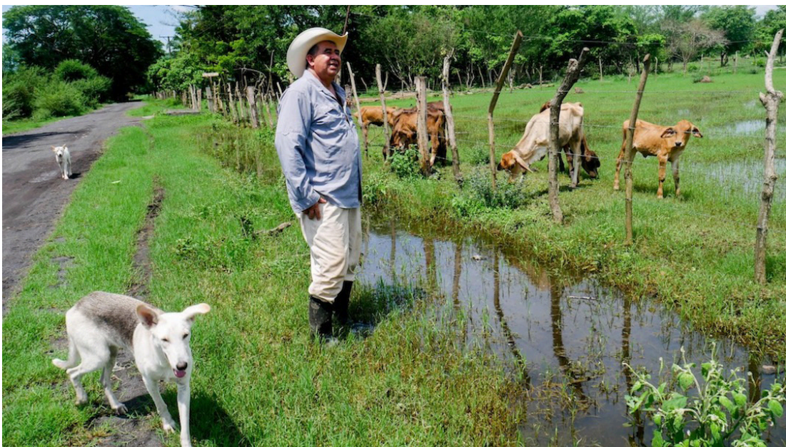
La organización alertó que la temporada de escasez, sumada a factores climáticos y al alza en costos, podría agravar la inseguridad alimentaria en el Corredor Seco centroamericano.