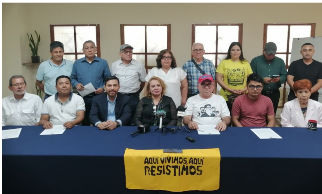
Organizaciones sociales y sindicales acompañan a la comunidad Santa Marta y a los Líderes ambientalistas que han enfrentado el proceso judicial por más de tres años, pero que han sido declarados inocentes en dos juicios.

Lo anterior, según consideró Navarrete, el sistema judicial, “está cooptado”, a pesar de ello, se logró “una victoria de este colectivo en donde se ha demostrado que con lucha se puede ganar”.