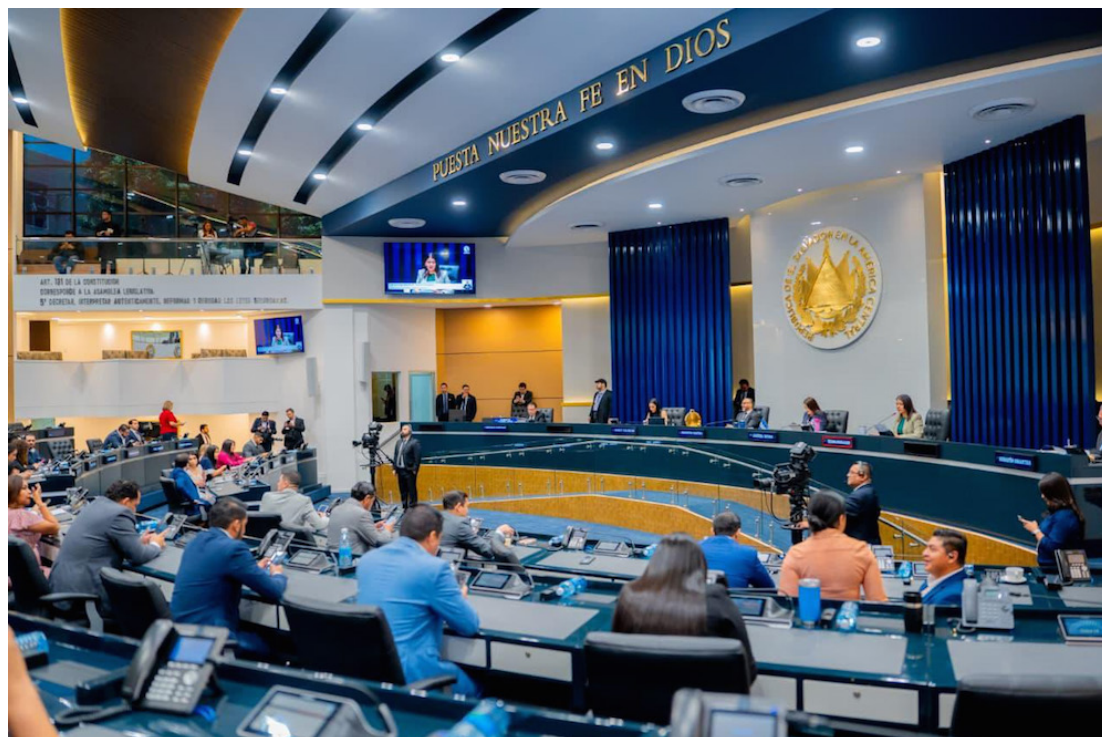
Asamblea Legislativa ratifica préstamos para instalar luminaria led en la red vial y renovar escenarios deportivos.

La ratificación del otro préstamo es por $150 millones con el Banco Centroamericano de Integración Económica (BCIE) para renovar un total de 13 escenarios deportivos, situados en nueve departamentos, los cuales serán intervenidos por el Instituto Nacional de los Deportes (INDES), a través del Programa de Construcción de Infraestructura y Rescate de Escen-