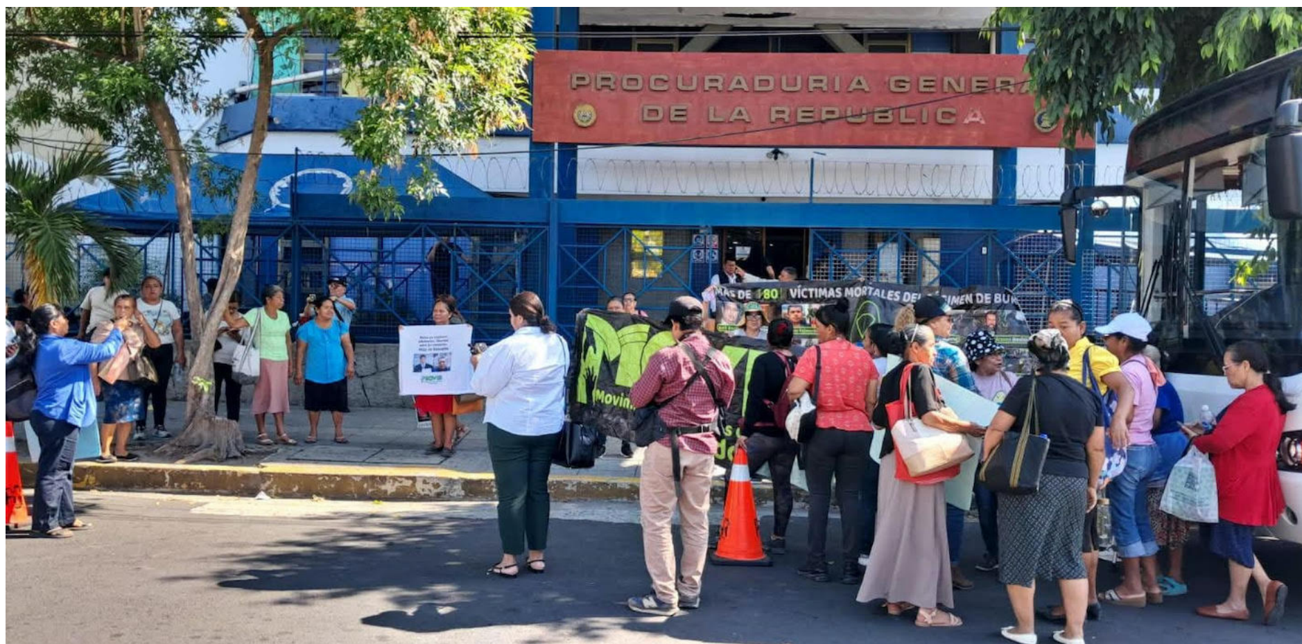
MOVIR ANTE LA PGR. EL MOVIMIENTO DE VÍCTIMAS DEL RÉGIMEN (MOVIR) SE CONCENTRA FRENTE A LA PROCURADURÍA GENERAL DE LA REPÚBLICA (PGR), EN EL CENTRO DE GOBIERNO, PARA PRESENTAR UN ESCRITO DIRIGIDO AL PROCURADOR GENERAL, RENÉ ESCOBAR, EN EL QUE LE SOLICITAN INFORMACIÓN SOBRE LOS PROCESOS JUDICIALES DE PERSONAS DETENIDAS BAJO EL RÉGIMEN DE EXCEPCIÓN.