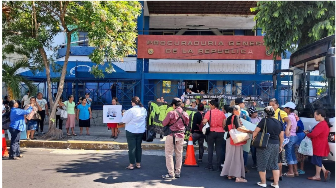
Integrantes de MOVIR presentan un escrito ante la Procuraduría General de la República para exigir información sobre procesos judiciales, atención a familiares y una defensa pública efectiva para personas detenidas bajo el régimen de excepción.

puesta campaña en redes sociales dirigida a criminalizar a madres que exigen justicia para sus familiares detenidos.