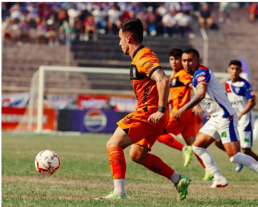
Firpo vence 2-1 a Águila en el Juan Francisco Barraza en el primer encuentro de semifinales del Clausura 2026.

Firpo, por su parte, mostró destellos iniciales con Víctor García y Nelson Díaz, quienes intentaban