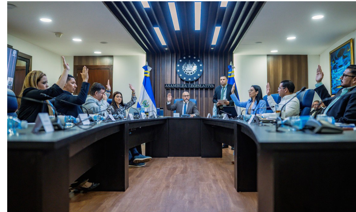
Comisión vota a favor de reformar las leyes secundarias para armonizarlas con la ratificación constitucional para habilitar la circunscripción 15 para los salvadoreños en el exterior.