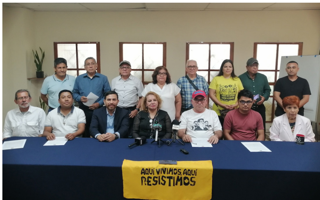
La comunidad espera que esta resolución sea el final de la FGR en su afán de procesar a los líderes ambientalistas.

“En la práctica, confirma que la acusación falsa montada contra ellos fue una acción de persecución contra el activismo ambiental y una criminalización que buscaba dismantlar la resistencia comunitaria contra los proyectos mineros”