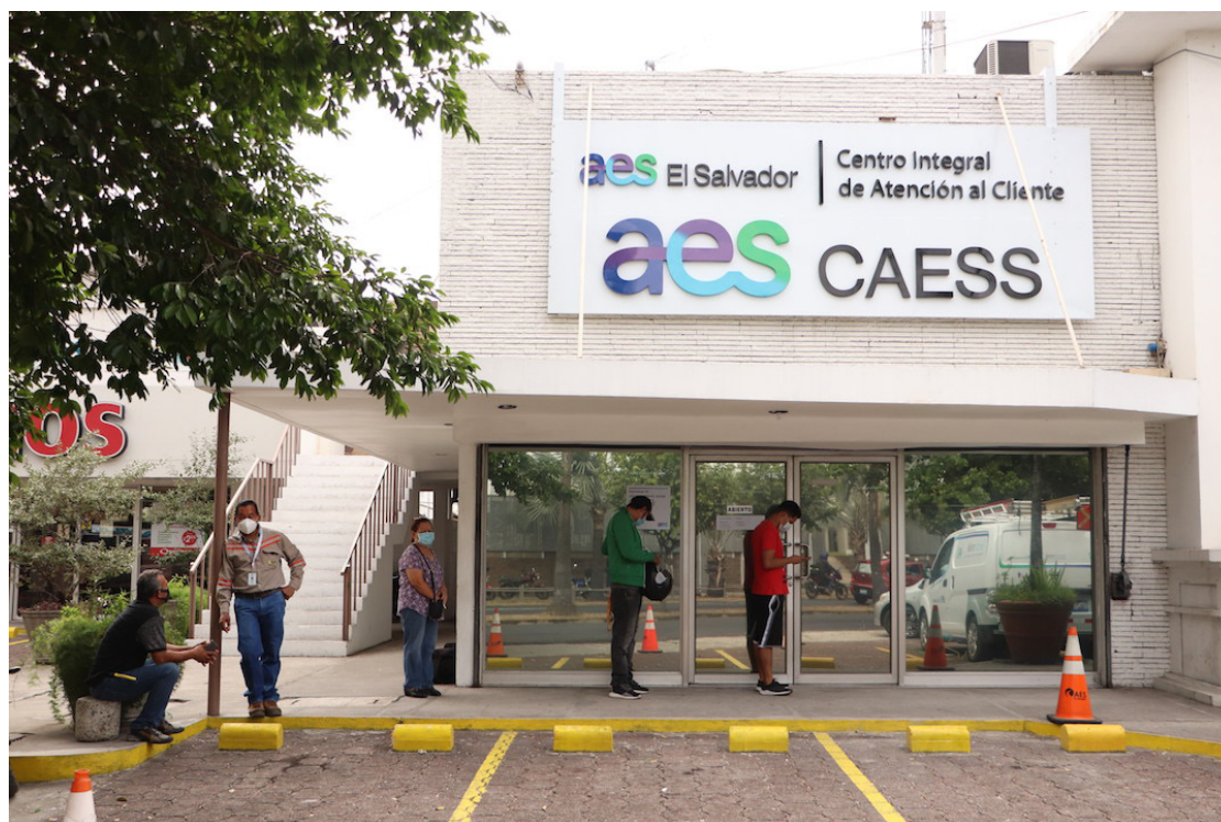
La distribuidora afirmó que mantiene procesos de revisión para casos de facturación que sus clientes consideren inconsistentes.

ra a la población que las tarifas establecidas por el Gobierno de El Salvador, a través de la Dirección General de Energía, Hidrocarburos y Minas, se mantienen sin modificaciones”, afirmó la empresa en un comunicado.