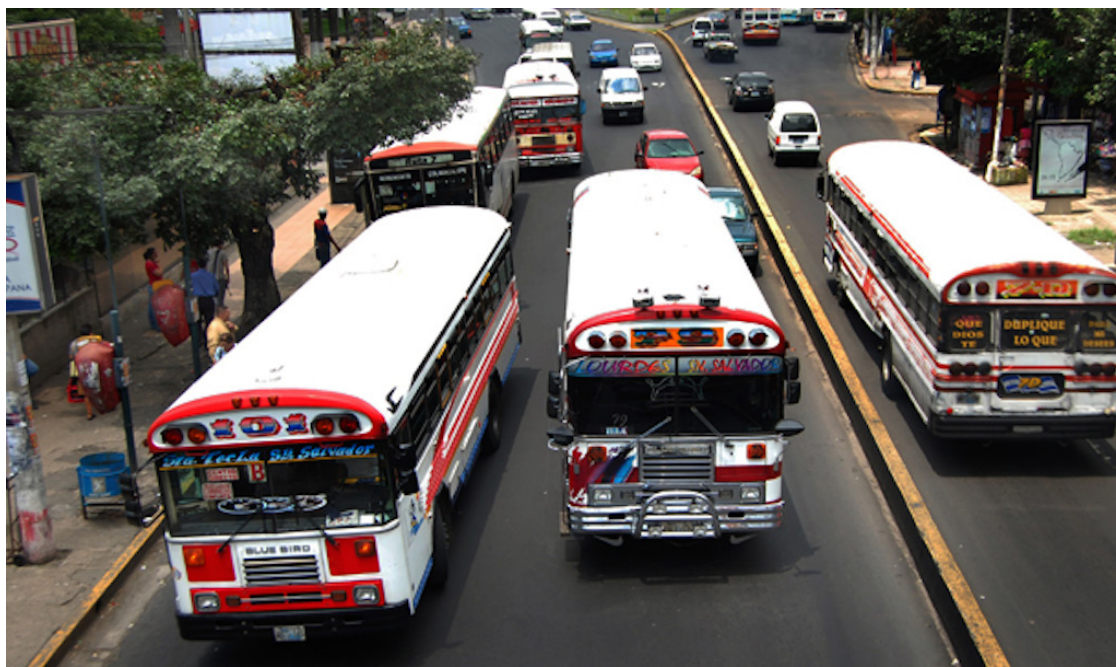
El sector afirma que el incremento en el diésel ya está impactando la operatividad de las rutas a escala nacional.

“La compensación económica, pues prácticamente casi al día, porque a pocos nos deben en marzo. Entonces, este dinero ya se fue en proveedores de dinero que nosotros hemos mantenido atrasados con el pago”,