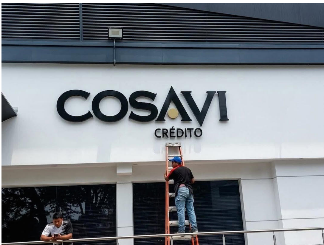
Afectados de COSAVI denunciaron que la retención de sus ahorros ha provocado graves afectaciones económicas, de salud y familiares.