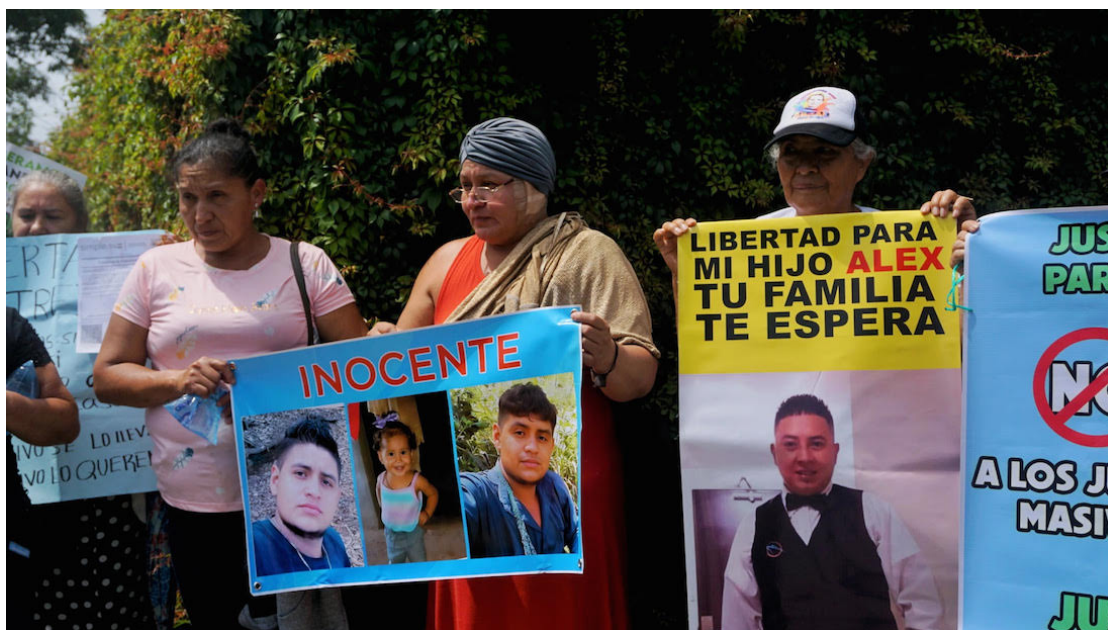
Amnistía Internacional llamó a garantizar derechos y escuchar a las madres de personas detenidas en El Salvador.

“Este 10 de mayo nuestros pensamientos están con las madres y familiares que piden algo básico frente al régimen de excepción en El Salvador: saber dónde y cómo están sus seres queridos detenidos”, expresó la