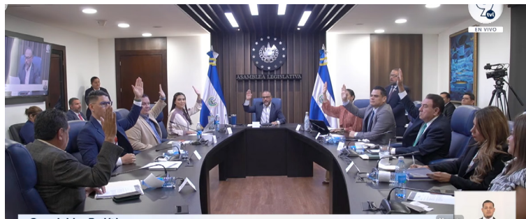
Los dictámenes de reforma constitucional serán aprobados este jueves en la sesión plenaria.