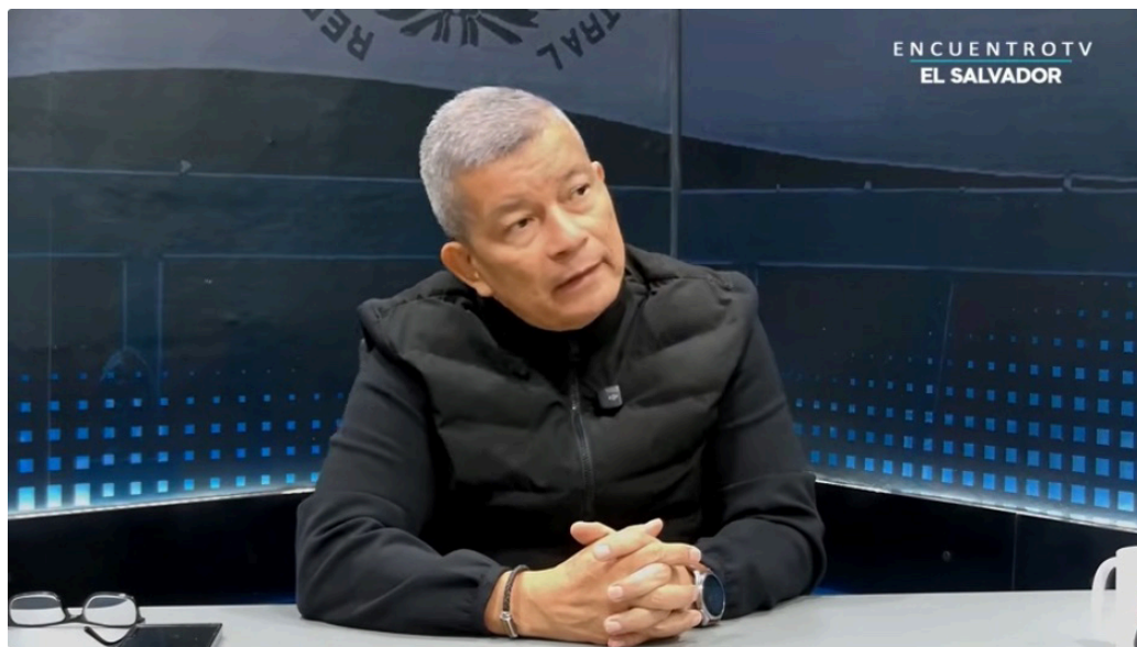
El dirigente del FMLN, Manuel Flores, defendió los logros en materia de políticas sociales ejecutados por los gobiernos de su partido, sobre todo en materia de Salud y Educación.