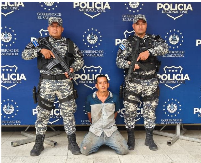
La captura del sujeto fue presentada en redes sociales.