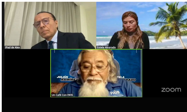
El exfuncionario también comparó la situación con el funcionamiento del sistema jurídico durante el régimen de Adolf Hitler.

Según Martínez, esto es posible porque, a su juicio, Casa Presidencial controla a la Policía Nacional Civil, a mandos del Ejército, a la Fiscalía General de la República, a la Corte de Cuentas de la República, y ha debilitado al Instituto de Acceso a la Información Pública. Aseguró que también ejerce control sobre la Procuraduría para la Defensa de los Derechos Humanos, gran parte de