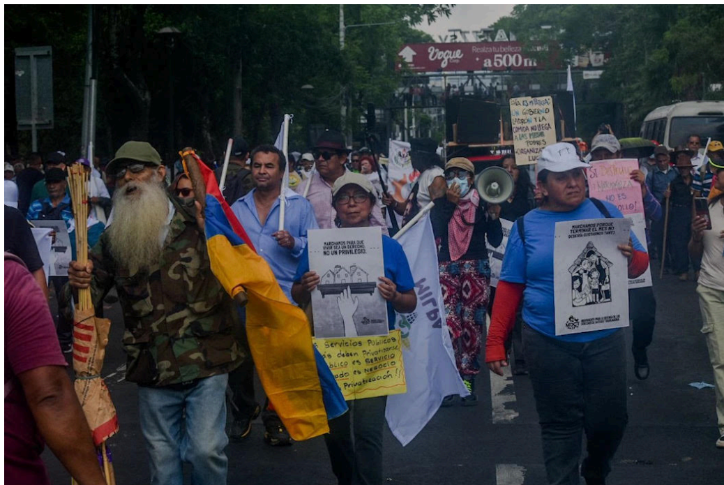
En la marcha pide la liberación de los inocentes detenidos, y condenan los despidos, la privatización de la salud.