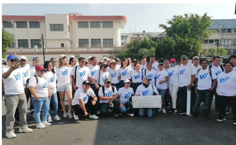
Miembros del partido VAMOS acompañaron la marcha del primero de mayo y pidieron salario digno, no más corrupción por parte de los gobernantes.