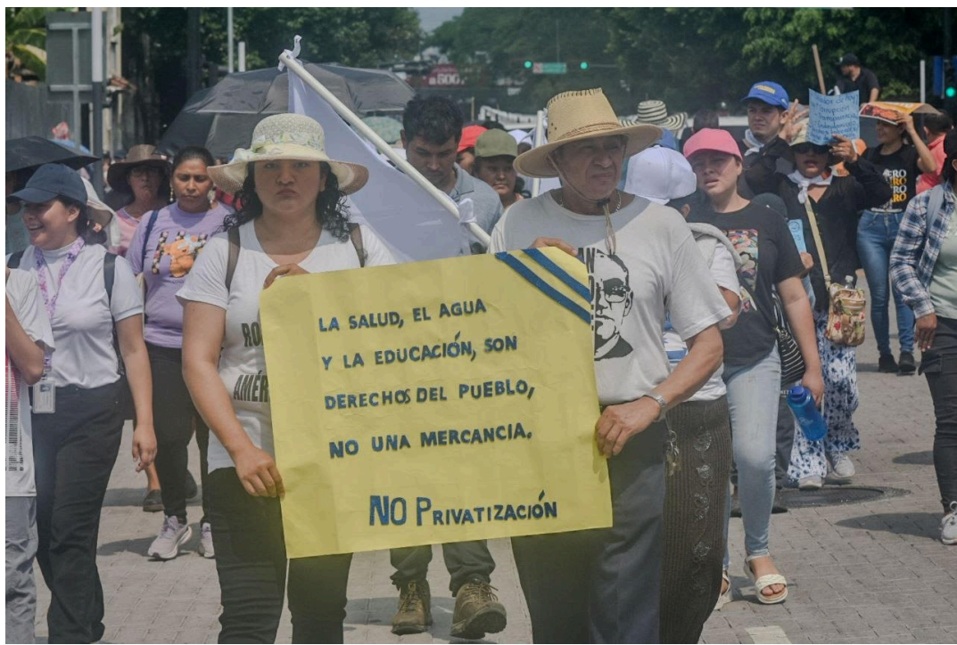
Diversas organizaciones sociales, sindicales, de salud y educación y la ciudadanía en general, marcha este primero de mayo, Día Internacional de la Clase Trabajadora.