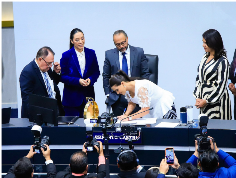
Diputada Alexia Rivas firma las reformas constitucionales para regular la participación electoral de los salvadoreños en el exterior y la “despartidización” del TSE.

La Asamblea Legislativa aprobó dos reformas constitucionales vía dispensa de trámite: la primera, para que la diáspora cuente con representación en la Asamblea Legislativa; la segunda, para que los magistrados del TSE no sean a propuestas de los partidos políticos.