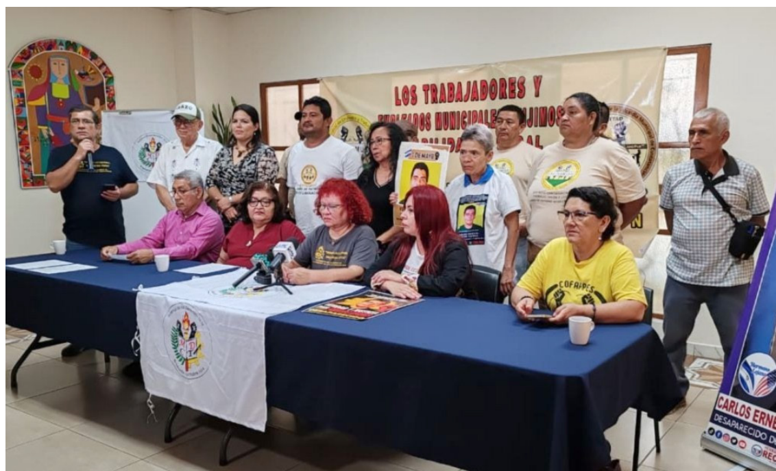
El Movimiento por la Defensa de los Derechos de la Clase Trabajadora (MDCT) iniciará su marcha en la plaza Divino Salvador del Mundo a las 8 de la mañana.

Pedirán el fin a la discriminación por identidad de género, orientación sexual, condición física e ideas políticas. El fin a la persecución de líderes sociales, comunitarios y defensores de derechos humanos. También, el fin del régimen de excepción y las detenciones arbitrarias, ya que esta medida ha permitido que miles de inocentes, incluido sindicalistas, sean detenidos y pasar encarcelados años, ya que esta medida ha estado vigente desde marzo de 2022, hace ya, 4 años.