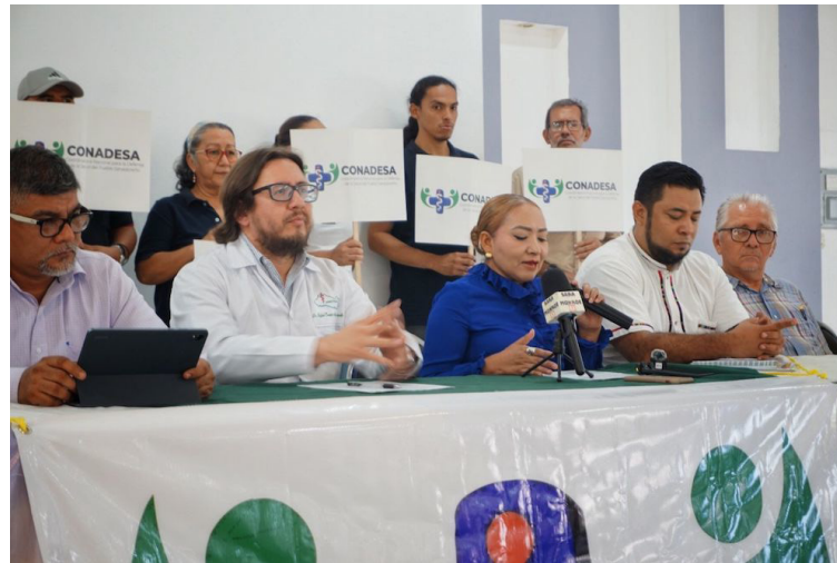
Las organizaciones expresaron su rechazo a la Ley de Alianzas Público-Privadas, al sostener que este modelo ha significado históricamente privatización encubierta.

“Este primero de mayo no es una fecha de celebración vacía; es una jornada histórica de lucha, memoria y resistencia. Hoy más que nunca, el pueblo salvadoreño enfrenta amenazas concretas contra derechos fundamentales conquistados con décadas de sacrificio”, señalaron las organizaciones.