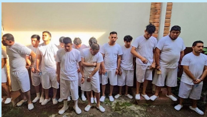
Los procesados recuperarán la libertad, pero deberán hacer trabajos de utilidad pública.

Como parte de las medidas impuestas, los procesados no podrán salir del país ni cambiar de domicilio; deberán presentarse cada 15 días ante la sede correspondiente y tienen prohibido asistir a eventos futbolísticos o a actividades que impliquen aglomeraciones.