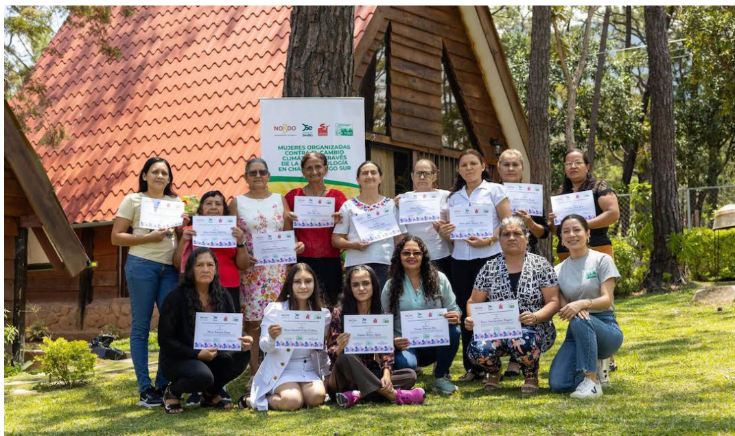
La asociación resaltó su trabajo en el empoderamiento y fortalecimiento de mujeres rurales a través de programas de desarrollo sostenible y enfoque de género, como la reciente jornada de formación introductoria en agroecología dirigida a ASMUSEG. Foto Diario Co Latino / Cortesía

Saúl Méndez @DiarioCoLatino / Colaborador