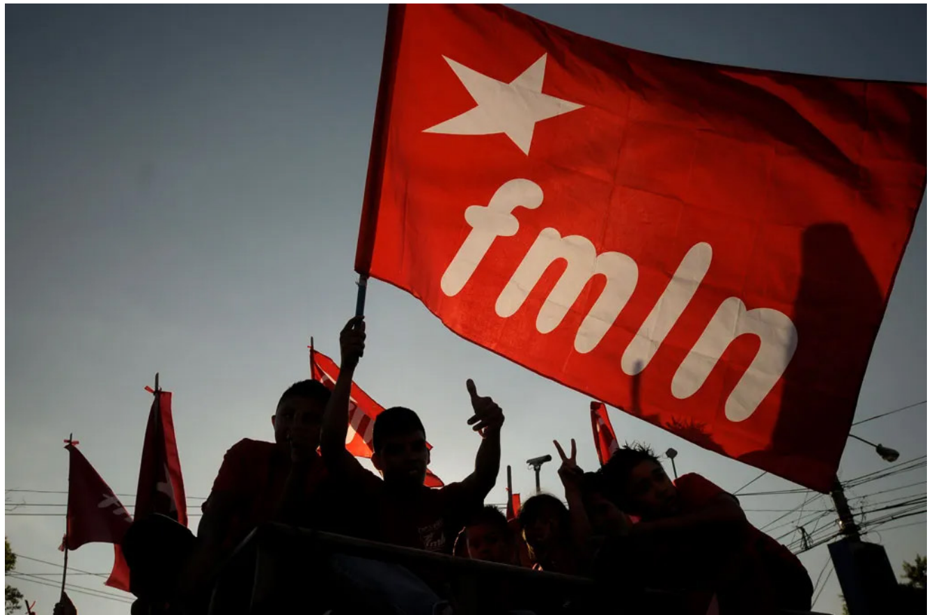
FMLN acompañará la marcha de este Primero de Mayo, que saldrá de la Plaza Divino Salvador del Mundo.

El Frente Farabundo Martí para la Liberación Nacional (FMLN) participará en la marcha que saldrá desde la Plaza Divino Salvador del Mundo a las 8:00 de la mañana, e instaron a la población a participar en la actividad.