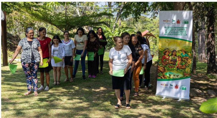
PROVIDA explica que se ofrece asistencia técnica permanente para garantizar mejores cosechas y fortalecer las capacidades de las mujeres productoras de ASMUPAZ.

Este programa también cuenta con el apoyo de Solidaridad Internacional - Andalucía y la Agencia Andaluza de Cooperación Internacional para el Desarrollo.