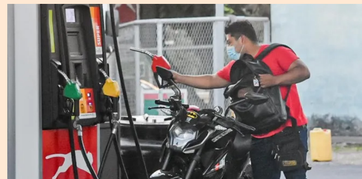
Conductores se abastecen de gasolina horas antes que entren en vigor los nuevos precios de referencia.

mundial; es una queja constante de la población salvadoreña y hemos visto otros Congresos de países vecinos como en Honduras o Guatemala de que han aprobado disposiciones para apoyar la economía también de sus ciudadanos”, planteó Villatoro; sin embargo, la propuesta fue rechazada.