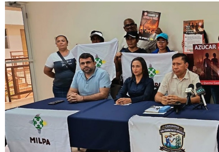
Milpa señala que el país enfrenta un proceso de desplazamiento forzado de comunidades campesinas e indígenas.

“En este conflicto se enfrentan claramente los intereses de una clase dominante, que concentra el poder político y económico, frente a los intereses de la clase trabajadora en sus diversas expresiones, especialmente en las comunidades campesinas e indígenas”, se-