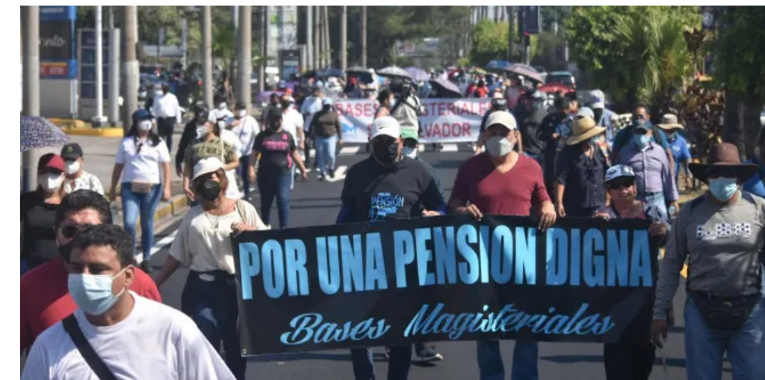
En diversos momentos, sindicatos y organizaciones sociales han marchado para exigir una pensión digna.

“La complejidad técnica del sistema de pensiones requiere un estudio exhaustivo de las variables demográficas, financieras y económicas que afectan su equilibrio de largo plazo”, consideró Lira en el decreto como