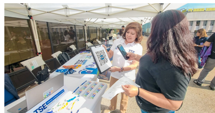
TSE realiza reuniones informativas con la diáspora para que puedan cambiar de dirección en su DUI.

“Hemos iniciado una campaña con bastante anticipación