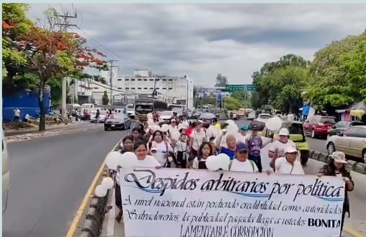
Una de las asistentes a la movilización pacífica denunció que en la departamental de Ahuachapán no fueron escuchados.

“No hemos sido escuchados, y eso es precisamente lo que exigimos: que se nos escuche como salvadoreños y como padres de familia, porque la educación debería ser una prioridad para nuestros hijos”, concluyó.