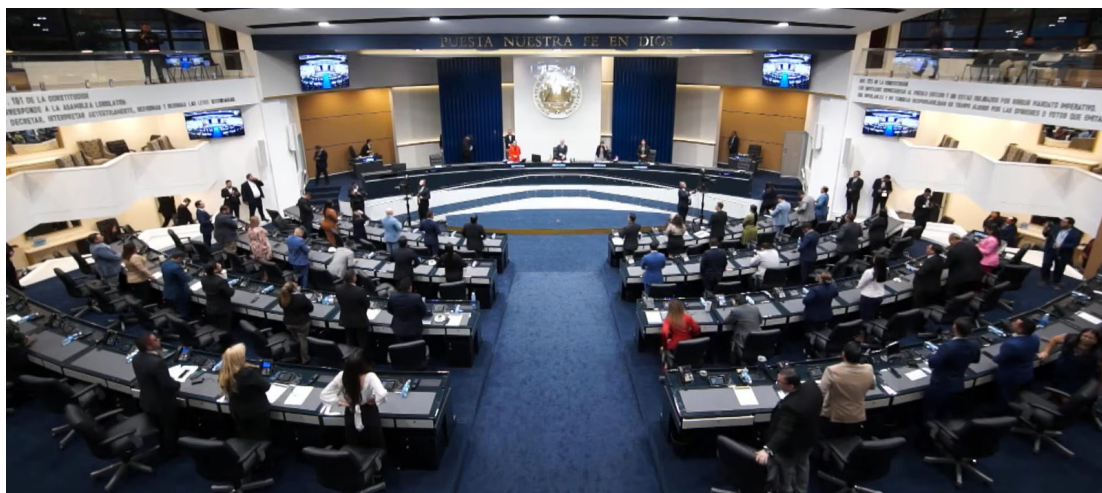
El oficialismo sigue con la aprobación de los préstamos sin pedir explicaciones al Gobierno sobre en qué serán utilizados realmente.