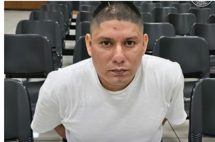
De acuerdo con Ormusa, la mitad de los casos de feminicidio en 2025 fueron perpetrados por parejas o exparejas de las víctimas.

La mitad de los crímenes (13) fue perpetrada por parejas o exparejas de las víctimas, mientras que los otros 13 corresponden