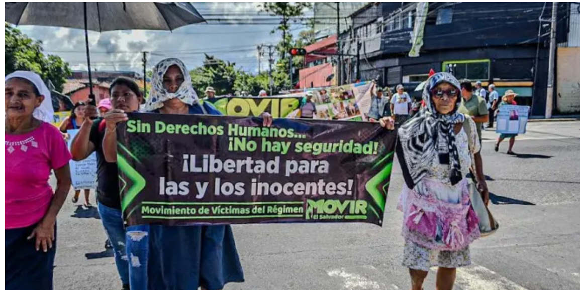
Mes con mes, las familias de las víctimas inocentes del régimen de excepción marchan para exigir la libertad de sus seres queridos.

En su comunicado de prensa, la CIDH consideró que la mejora de los índices de seguridad en el país indicaría que no persisten las razones objetivas iniciales que justificaron la emergencia. En este contexto, “el Estado