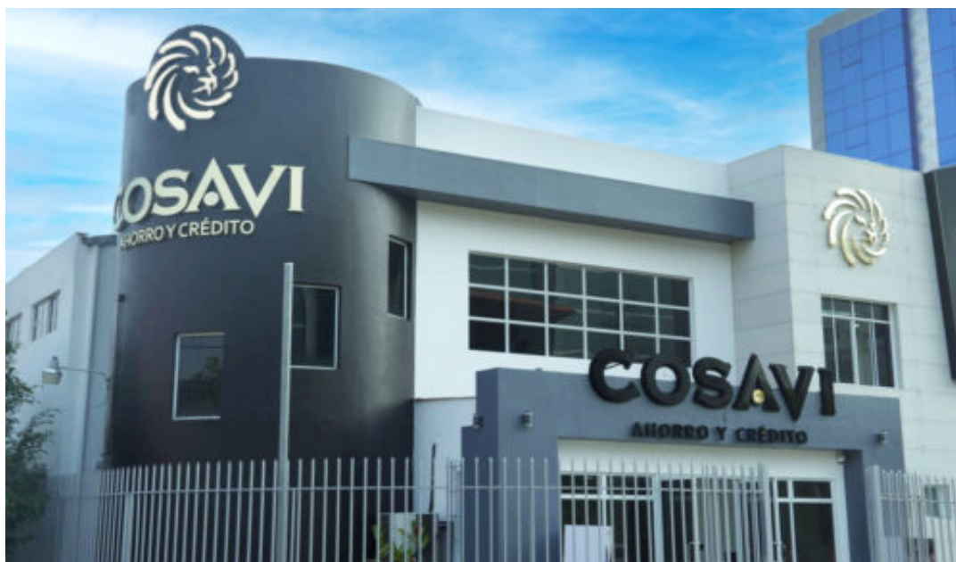
Durante la concentración, los asistentes guardaron un minuto de silencio en memoria de las dos víctimas recientes y de las otras 11 personas fallecidas en el contexto del caso.