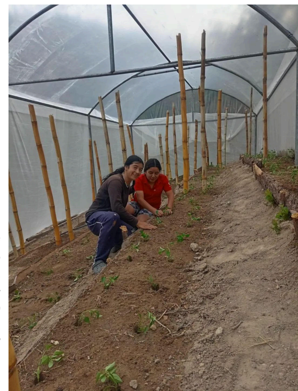
El uso de invernaderos permitirá regular factores como el clima, la humedad y las plagas.

“Empatizamos con las comunidades en condición de vulnerabilidad, conociendo su realidad, compartiendo sus luchas y acompañándolas para lograr un desarrollo sostenible”, concluyó PROVIDA.