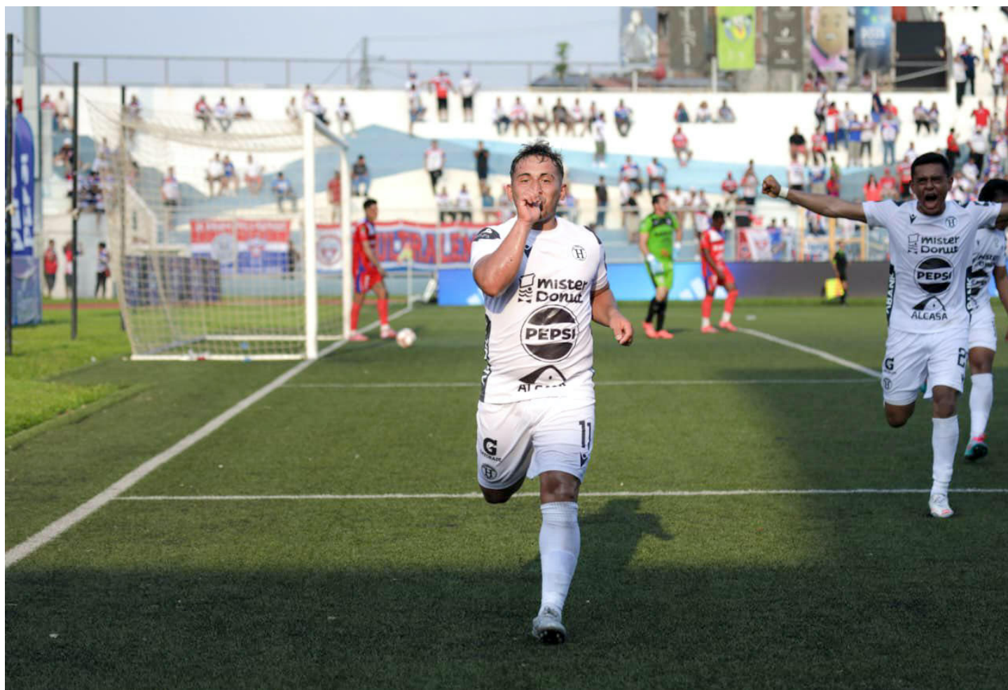
CD Hércules empata 2-2 con Firpo en la jornada 20 del Clausura 2026.