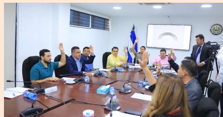
Momentos en que la Comisión de Hacienda vota a favor para la ratificación de dos préstamos por $576 millones.

También, los legisladores aprobaron la ratificación de un préstamo por hasta $75 millones con la Corporación Andina de Fomento (CAF), destinado a financiar la segunda fase del programa de salud digital Doctor SV.