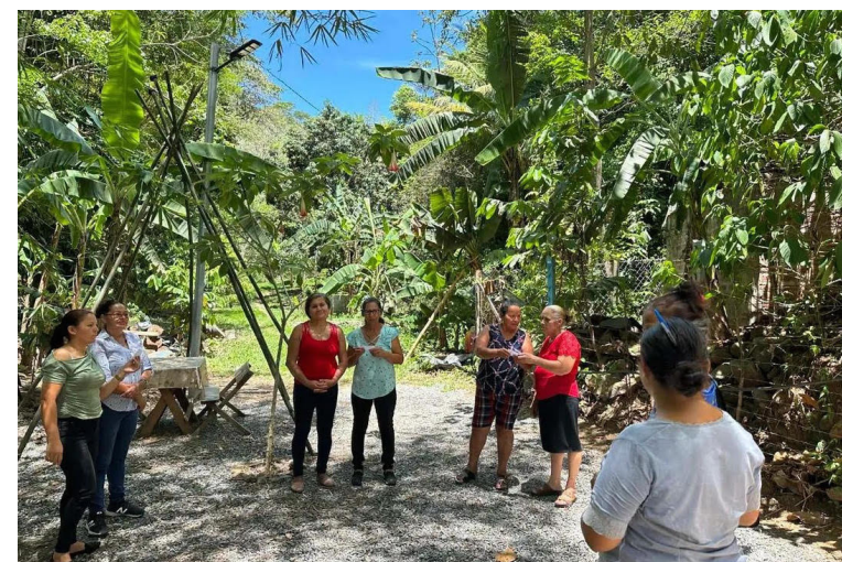
El encuentro busca que las participantes identifiquen que muchas situaciones de desventaja no son “normales” ni individuales, sino estructurales.