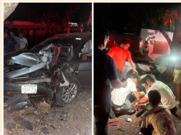
Las autoridades piden a los conductores que manejen a la defensiva y que respeten las señales de tránsito para evitar incidentes.

Las principales causas de los siniestros viales, lesionados y fallecidos en este año es la distrac-