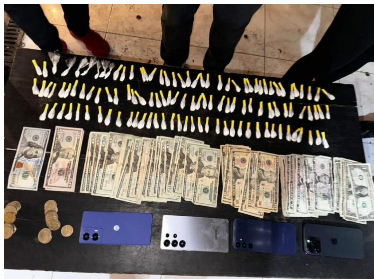
Esto es parte de los decomisos que realizaron las autoridades durante la madrugada de este domingo.