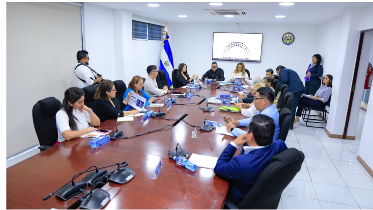
Legisladores votan a favor que El Salvador y Bolivia suscriban un acuerdo comercial, el cual será aprobado este martes en plenaria.

Además, ambos países reconocerían productos propios con valor especial. Bolivia re-