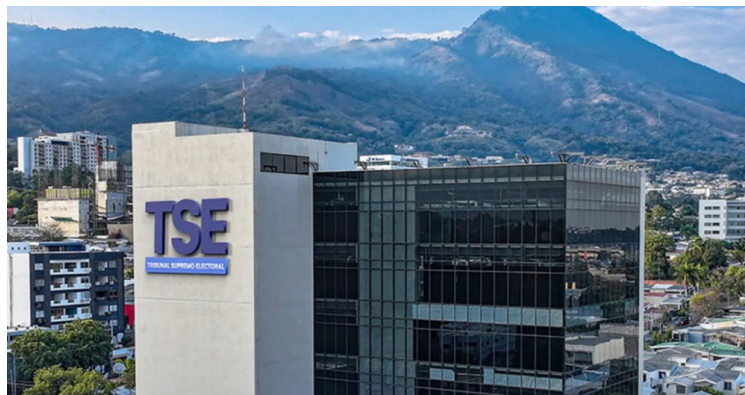
El Tribunal Supremo Electoral adquirirá el inmueble donde funciona sus oficinas centrales por $10.1 millones.

El decreto establece que la modificación entrará en vigencia una vez publicada en el Diario Oficial, garantizando así que el TSE cuente con instalaciones propias y permanentes para la organización de los próximos procesos electorales. Esta reforma de presupuesto sería estudiada este lunes en la Comisión de Hacienda y Especial del Presupuesto, para ser aprobada este martes en la sesión plenaria.