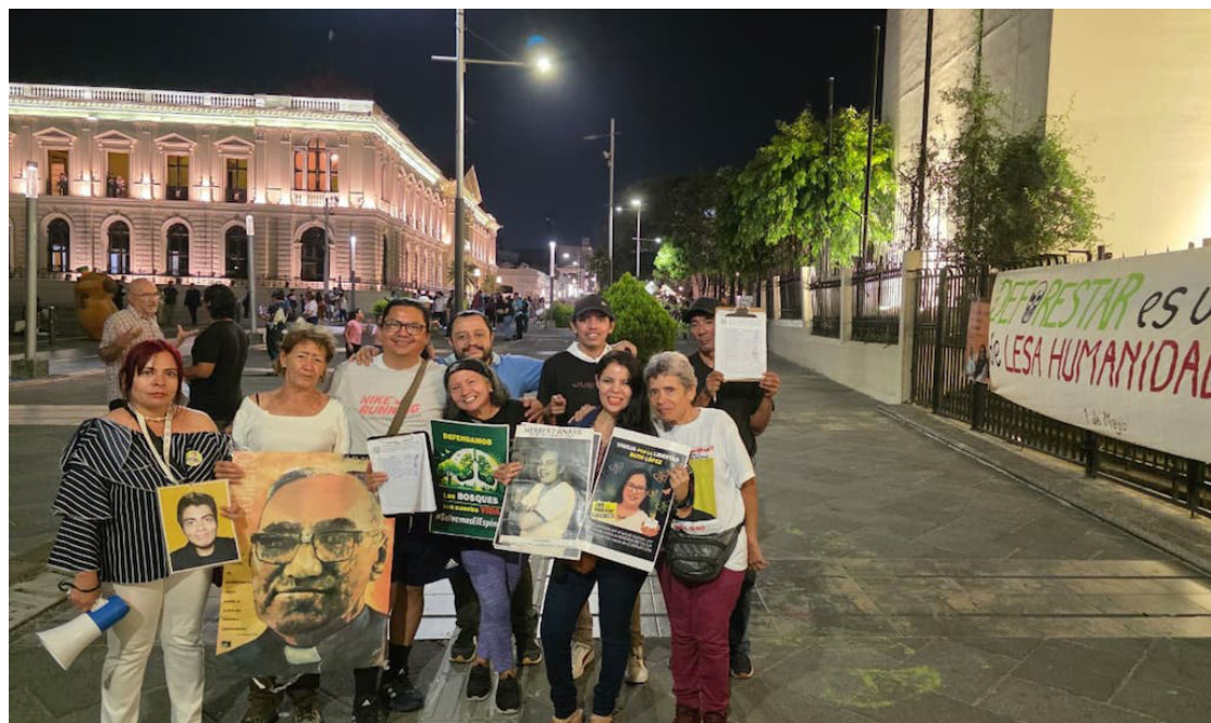
Las vigiliadas se realizan en el Centro de San Salvador, donde los ciudadanos expresan sus posturas por la defensa de la vida, el medio ambiente y los derechos humanos.

Aparte de dicho colectivo, a estas vigiliadas se unen los movimientos ciudadanos, Alerta Carlos Abarca, Todos Somos El Espino, así como de-