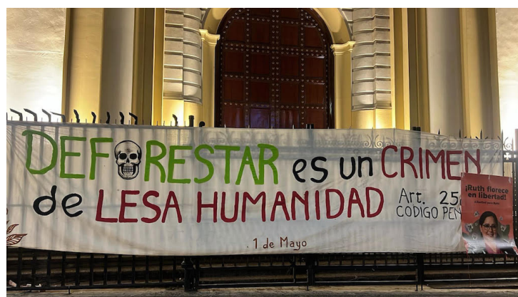
La primera vigiliada se dio, en el contexto del Día de la Declaración Universal de los Derechos Humanos, el 15 de diciembre de 2015.

Incluso, en febrero de este año, la comunidad denunció que al menos 100 agentes de seguridad del Estado garantizaron el acceso de una maquinaria pesada que se encontraba al inicio de la comunidad, ya que los habitantes se lo habían impedido. La comunidad enfrenta este problema desde hace casi una década, pues en 2017 también se preten-