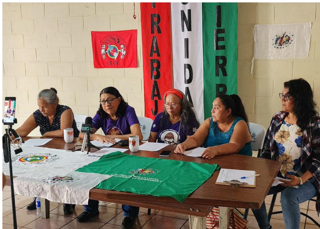
Las organizaciones señalaron que sin acceso seguro a la tierra no es posible garantizar la soberanía alimentaria, la sostenibilidad de la vida rural ni la justicia social.

“Frente al avance del agrobusiness, el neocolonialismo y la militarización de los territorios, defendemos el derecho de los pueblos a permanecer y decidir sobre sus territorios”, manifestaron. También recordaron que