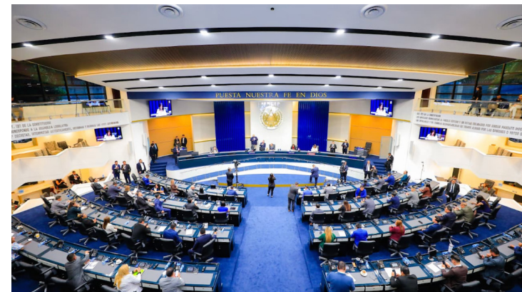
La Asamblea Legislativa le aprueba todos los préstamos que le pide el Gobierno, incluso con dispensa de trámite y sin discusión.