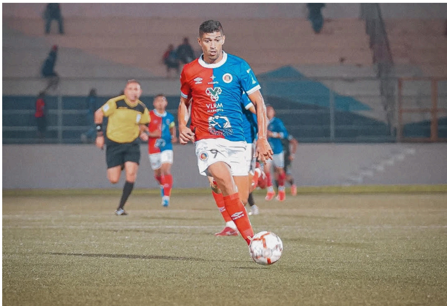
FAS e Inter empatan 2-2 en la jornada 19 del Clausura 2026, de cara a los cuartos de final.