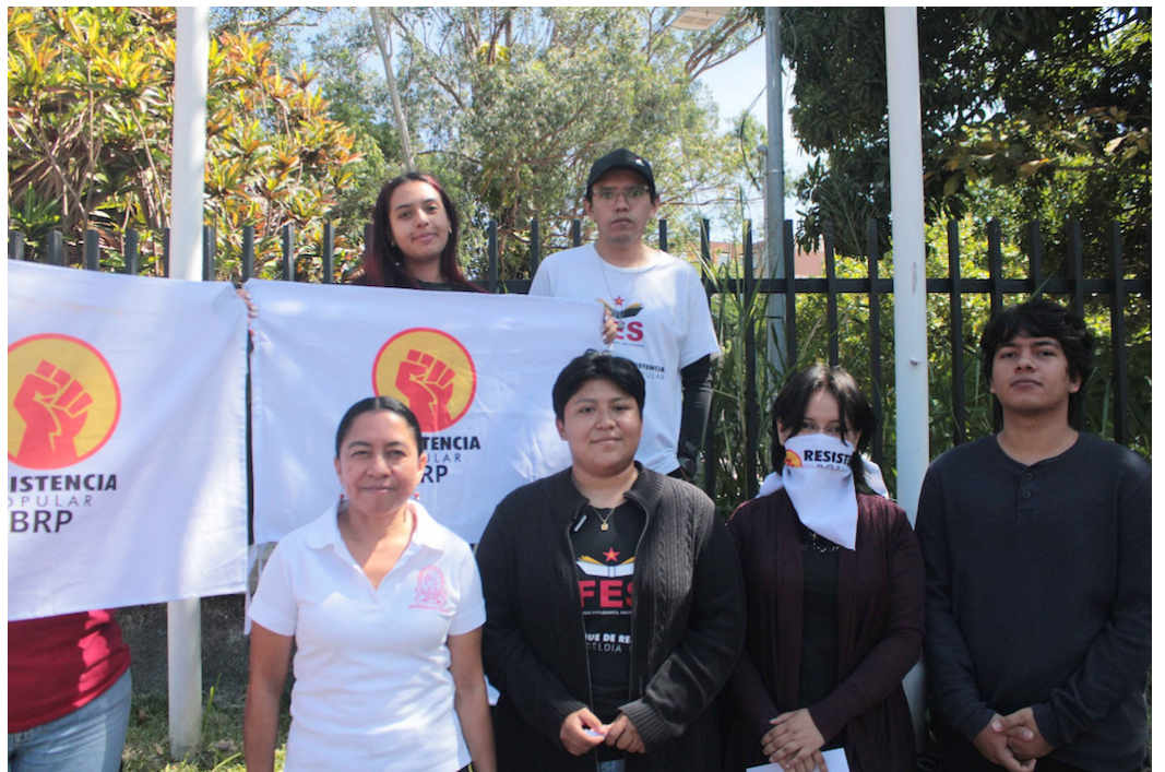
Organizaciones estudiantiles rechazan la Ley de Asocios Público Privado, ya que consideran que es un intento por privatizar el sistema de educación y salud.