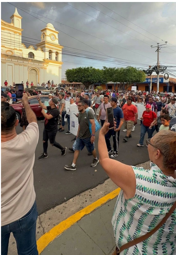
En Chalatenango se realizan protesta multitudinarias para exigir respuestas por el caso Credicash.