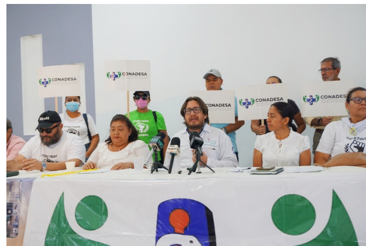
La Ley forma parte de un conjunto de medidas, entre ellas la ya conocida Ley de Red Nacional de Hospitales, que en conjunto construyen el marco legal necesario para avanzar hacia la privatización de la salud pública en El Salvador.

Asimismo, reiteraron la demanda de derogar la Ley de