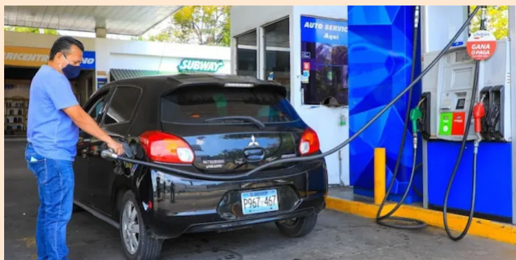
El gobierno no ha implementado políticas públicas para paliar la situación de los combustibles.

Los nuevos precios estarán vigentes del 14 al 27 de abril.