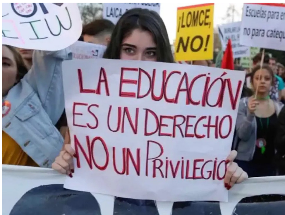
La propuesta de Ley de Alianzas Público Privadas ha causado preocupación en los sectores de salud, educación y organizaciones ya que, consideran que es un intento de privatizar los servicios básicos.