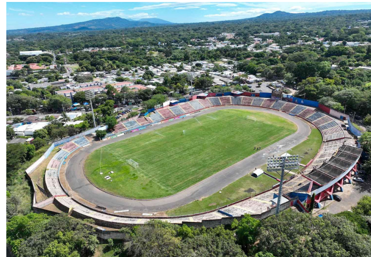
Uno de los escenarios a remodelar es el Estadio Oscar Alberto Quiteño, en Santa Ana, casa de Club Deportivo Fas.

“PRODEPORTE II tiene como visión consolidar un sistema nacional de infraestructura deportiva que complemente el legado de PRODEPORTE I en la capital, pero que al mismo tiempo fortalezca el tejido social y comunita-