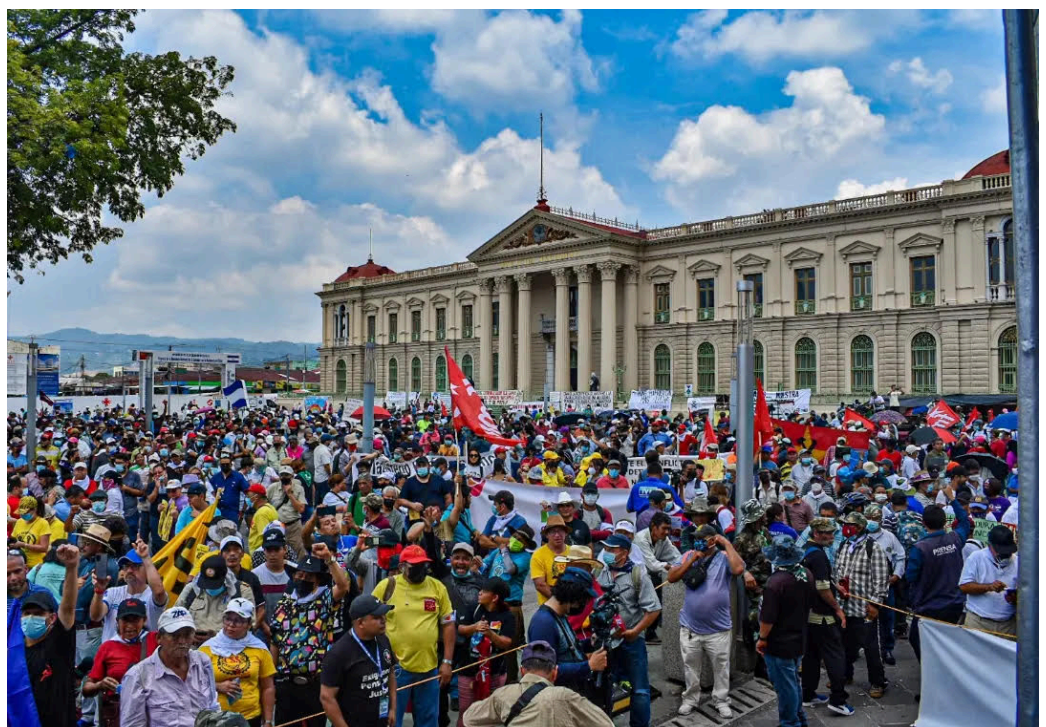
El BRP, año con año, sale a marchar para reivindicar los derechos de la clase trabajadora.

El sector de salud también ha convocado a una marcha blanca para el primero de mayo, en el contexto del Día Internacional de la Clase Trabajadora.