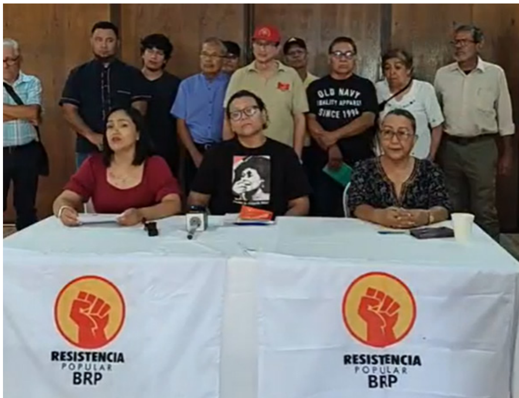
A través de una conferencia de prensa, varias organizaciones también respaldaron la expresión social que se realizará el primero de mayo.