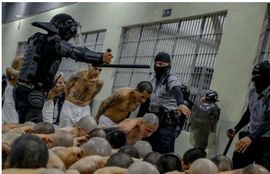
Custodios ordenan a reos que se encuentran en el CECOT.

“Tener un 36% de personas presas inocentes, es un crimen contra la humanidad, se trata de campos de concentración de población civil, gente apresada porque tiene un tatuaje o es joven, así no se disminuye una tasa de homicidios