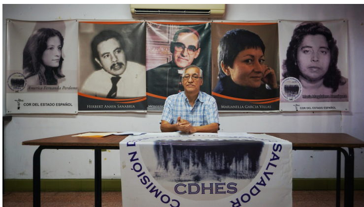
Las víctimas, junto a organizaciones de derechos humanos, presentaron en octubre de 2021 ante la Asamblea Legislativa un anteproyecto de Ley de Justicia Transicional. Sin embargo, hasta la fecha, la Comisión de Justicia y Derechos Humanos no ha estudiado la propuesta. Foto Diario Co Latino / Saúl Méndez.

Saúl Méndez @DiarioCoLatino / Colaborador