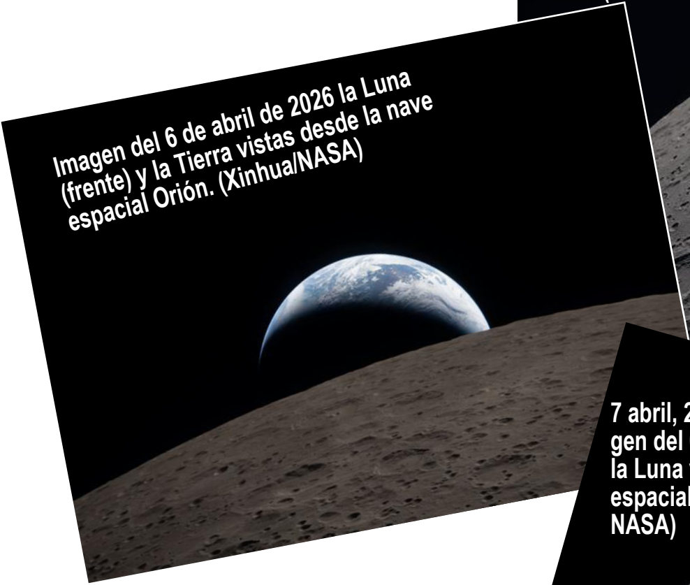
7 abril, 2026 (Xinhua) -- Imagen del 6 de abril de 2026 la Luna vista desde la nave espacial Orión.