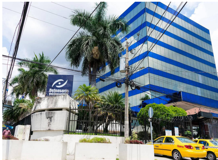
Uno de cada tres establecimientos inspeccionados presenta algún tipo de infracción.

busca “garantizar una canasta básica accesible a nuestra población”, por lo que se mantiene una vigilancia constante sobre productos esenciales como arroz, frijol, maíz, azúcar y alimentos pe-