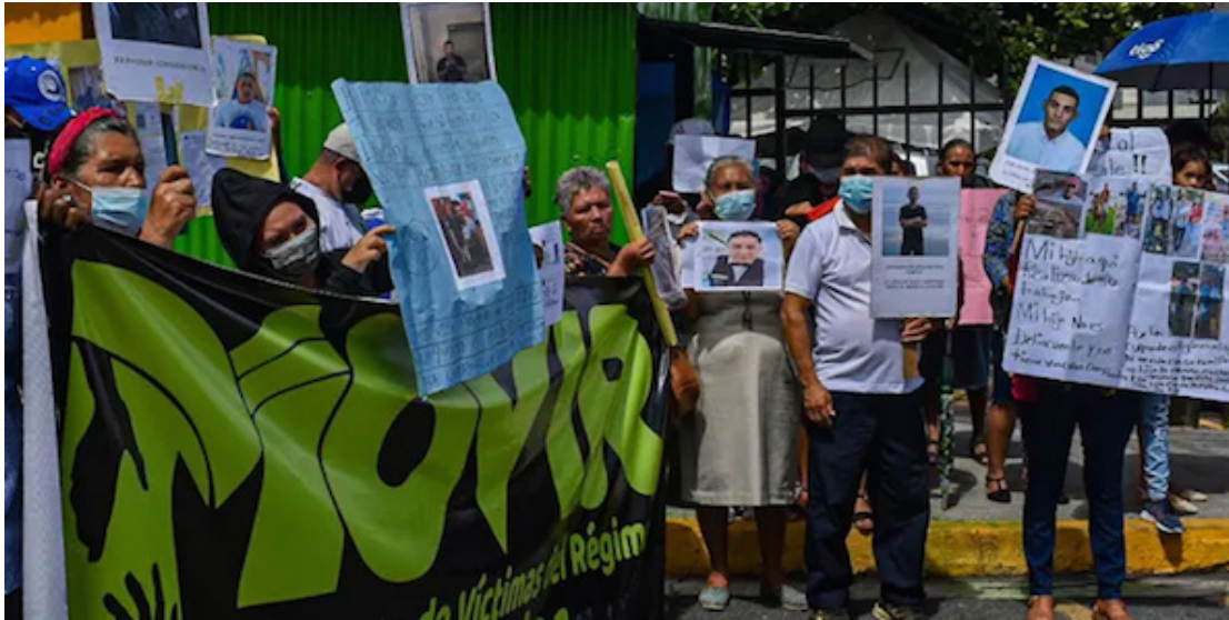
Cientos de personas salen a las calles a marchar para pedir libertad a sus inocentes detenidos bajo el régimen de excepción.