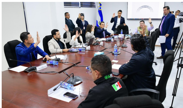
Comisión de Hacienda emite dictamen para ratificar préstamo por $150 millones para proyecto de control de inundaciones.

El segundo componente se centra en el fortalecimiento institucional, con la actualización del Plan Maestro de Drenaje del AMSS, estudios de preinversión y