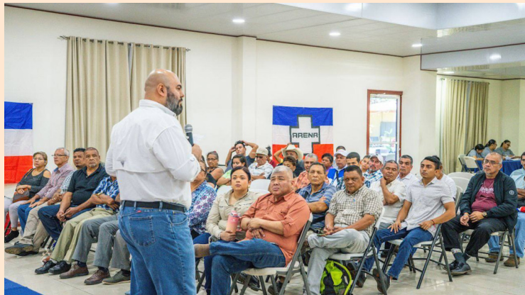
La Comisión Electoral Nacional (CEN) de ARENA lanza la convocatoria para que sus miembros activos participen en las elecciones internas.

En la elección presidencial de 2024, ARENA obtuvo 177 mil votos válidos, finalizó en tercer lugar, luego de Nayib Bukele (Nuevas Ideas) y Manuel Flores (FMLN).