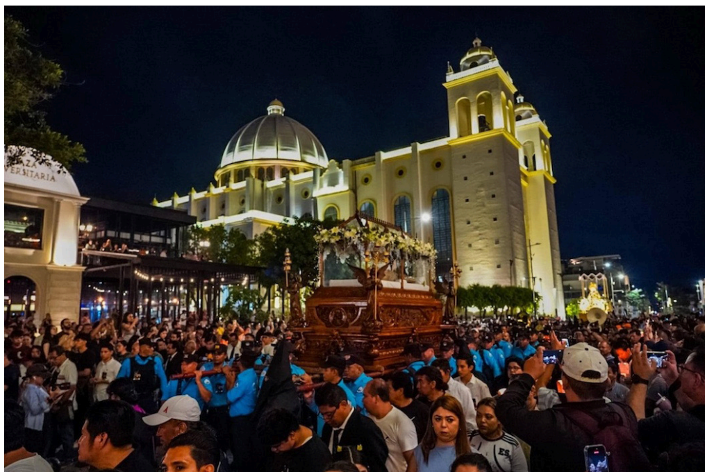
Los fieles católicos desarrollaron procesiones y misas durante la semana Mayor, la cual se vivió con devoción y espiritualidad.