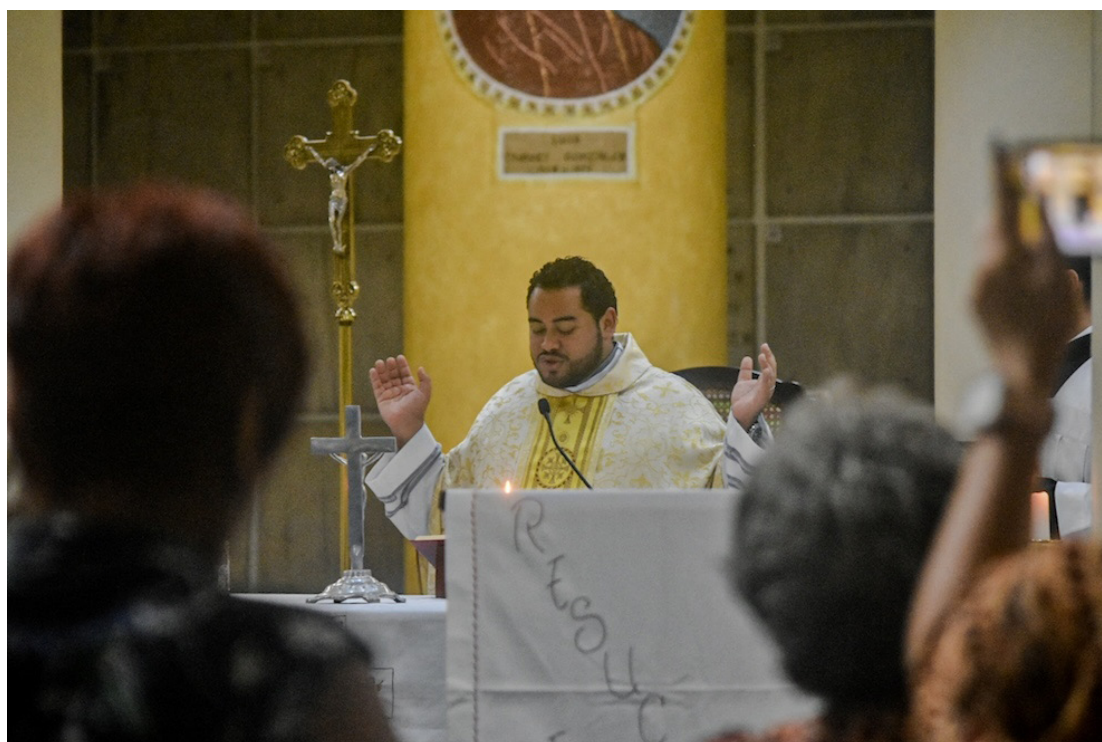
El Domingo de Resurrección es la finalización de la Semana Santa con la invitación de reflexión de las actitudes diarias con el mandamiento del señor.

Cuando el religioso se pone en el camino del Señor, “Dios se deja encontrar”; “el problema es que muchos de nosotros seguimos viviendo como si Cristo no hubiera resucitado”.