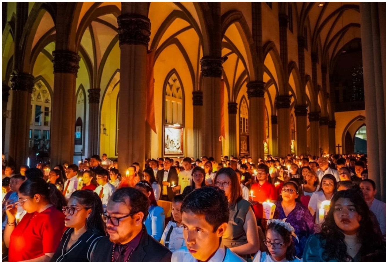
La vigilia pascual, sábado por la noche, que anuncia la resurrección. Primero la oscuridad por la muerte, luego las luces con las candelas que anuncia la vida.