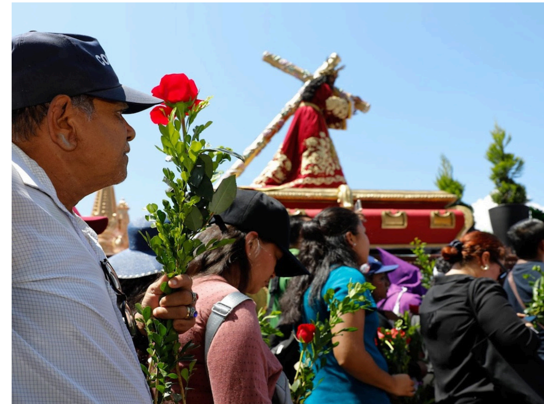
El Vía Crucis y el Santo Entierro son las actividades más representativas de la Semana Santa.

El Vía Crucis llegó minutos antes de las 12 del mediodía. Dentro de la iglesia El Calvario, se llevó a cabo una serie de oración. La imagen de Jesús permaneció clavada en la cruz hasta las tres de la tarde, cuando se iniciaron los Santos Oficios. Dicho momento se conoce como Celebración de la Pasión, la cual incluye la venera-