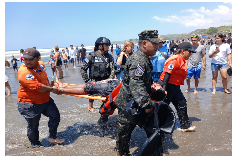
Autoridades auxilian a personas que se encontraban a bordo de una embarcación que volcó en la playa El Cuco debido a fallas en el motor y al oleaje.